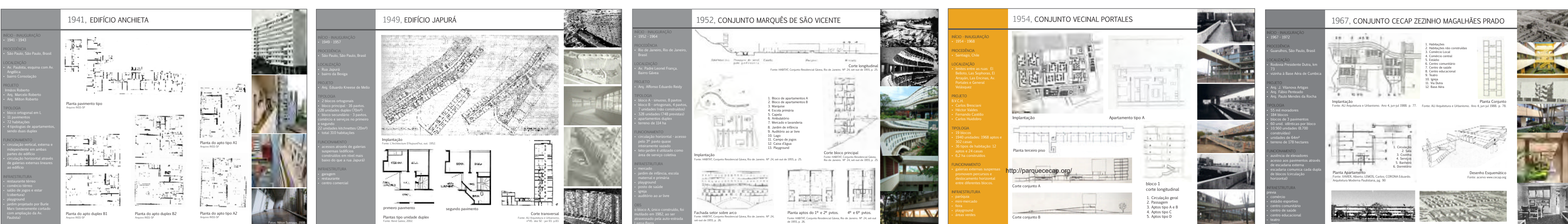
1941, EDIFÍCIO ANCHIETA BRASIL

Portanto, até o momento, os principais resultados consistem em: montagem do arquivo de projetos; trabalho de composição gráfica desta base, em forma de fichas e linha de tempo.