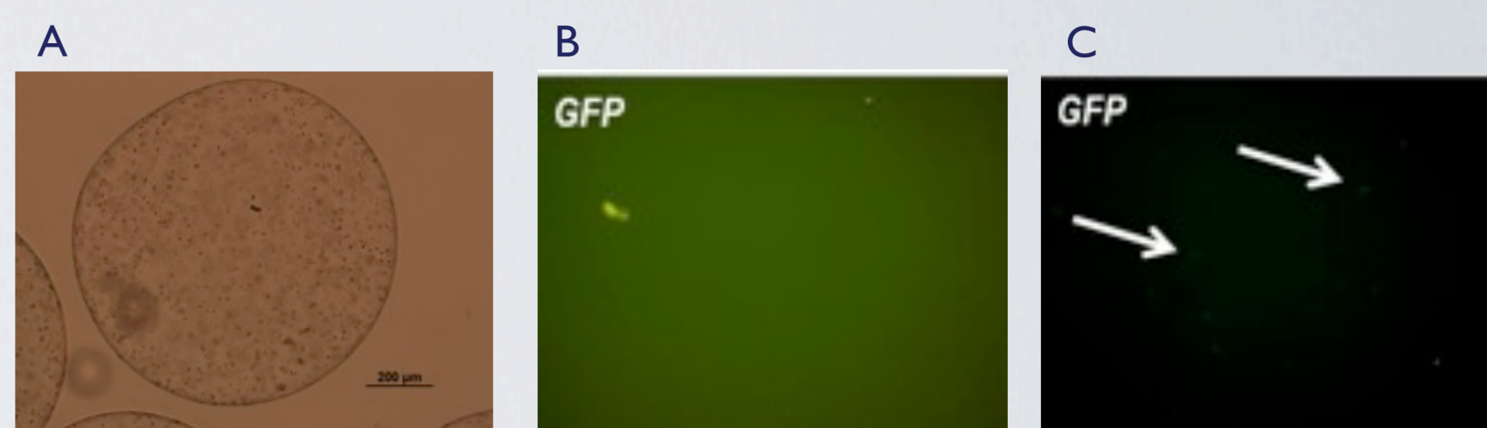
Figura 1.(A) Capsula de alginato com células FMN-MO/GFP + . (B) Células recuperadas das cápsulas vazias e (C) de cápsulas contendo células GFP + após 7 dias do implante. Flechas indicam células

Encapsulamento e recuperação de células 7 dias após o implante.