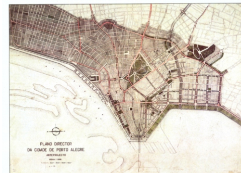
Plano Gladosch, Porto Alegre -RS, fonte PMPA-SPM

A investigação que está sendo apresentada tem como temática "O Projeto Urbano da Cidade Ibero Americana". O objeto de pesquisa inicial é a cidade de Porto Alegre. Buscando seus antecedentes na cartografia urbana e na bibliografia complementar, o trabalho visa um melhor entendimento da evolução urbana da cidade. A partir da organização de uma base de dados especializada com referências cartográficas, arquivísticas e bibliográficas coletadas sobre o tema, uma nova sistematização foi desenvolvida. Os dados de cada mapa são coletados e registrados em ordem cronológica, logo em seguida, ocorre a etapa de análise individual e posteriormente em conjunto dos mapas; pretende-se como resultado final uma publicação com o panorama do projeto urbano da cidade. A partir da análise dos mapas realizados em diferentes momentos e por diferentes motivos, a investigação busca um entendimento melhor das razões que levaram a cidade a ter o traçado hoje existente e que semelhanças e diferenças a mesma possui em relação às demais metrópoles da América Latina. Este estudo é uma oportunidade de atualizar, organizar e disponibilizar referências bibliográficas e arquivísticas especializadas, coletadas em diferentes instituições públicas, além de difundir este material ao público acadêmico. As cartografias registradas até o momento vão desde 1833 até início da década de 1950. Realizadas em vários momentos, registram a evolução urbana, a história da cidade e a configuração da sua estrutura.