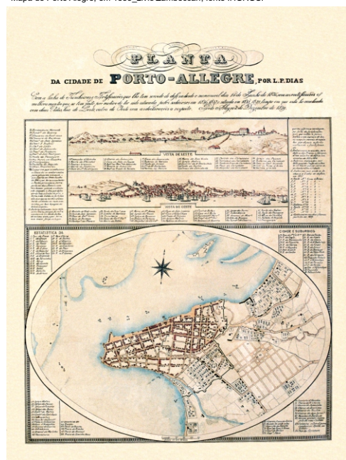
Mapa de LP Dias, 1839, Porto Alegre, fonte IHGRGS.