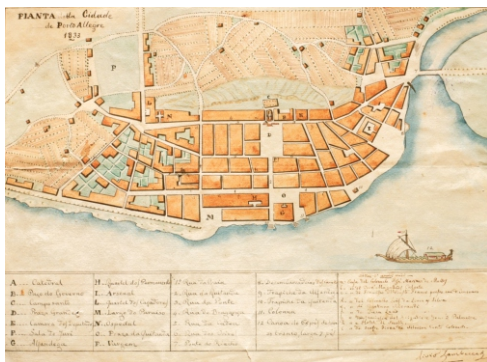
Mapa de Porto Alegre, em 1833_Livro Zambeccari, fonte IHGRGS.