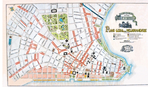
Plano Geral de Melhoramentos de Porto Alegre (1914), eng. João Moreira Maciel.