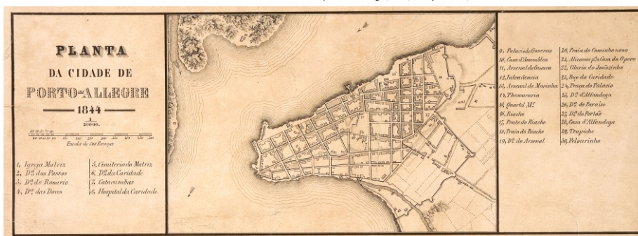
Mapa de 1844, Porto Alegre -RS.