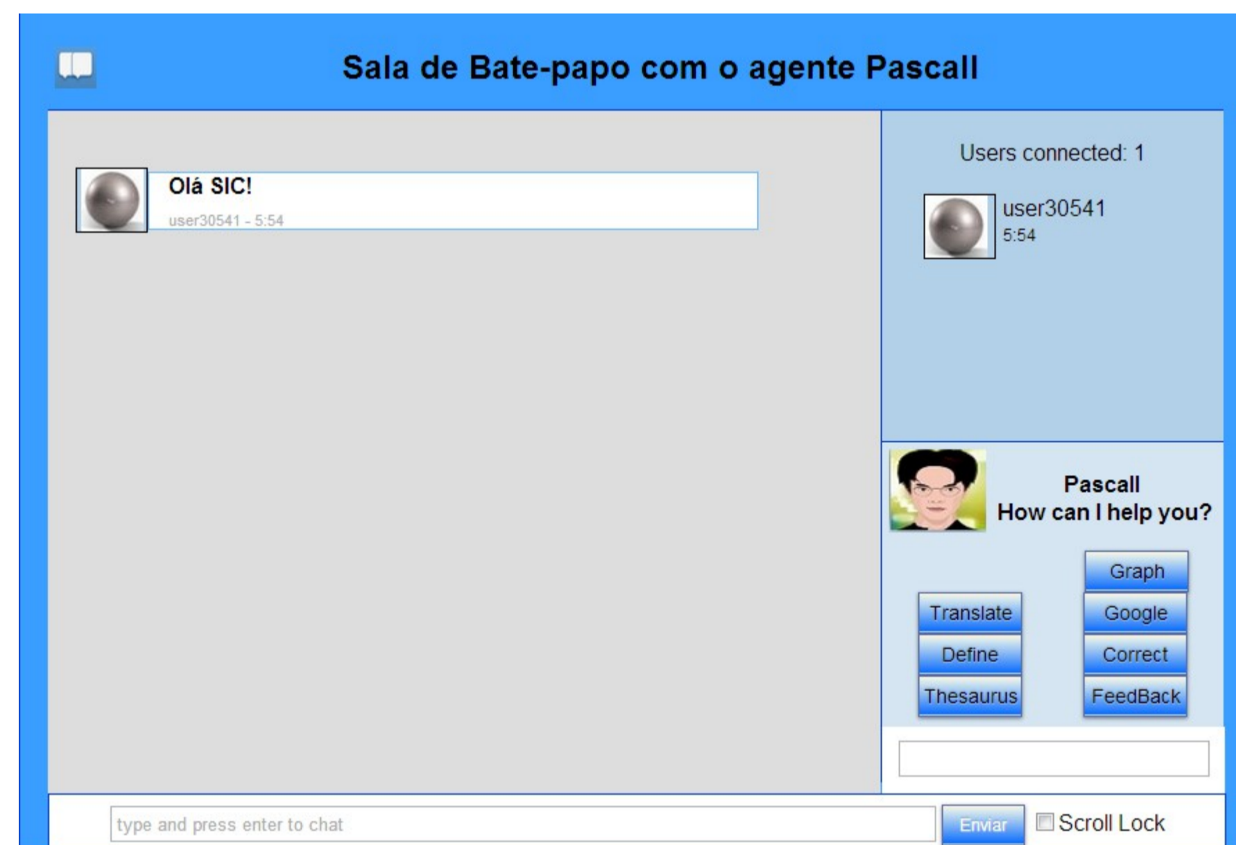
Figura 2: Interface gráfica do cliente da aplicação de chat

A aplicação Thesaurus , tal como o TreeTagger foi implementada na linguagem java, utilizando APIs de uso livre para utilização acadêmica. O funcionamento da ferramenta consistem em, quando acionada, verificar se dois conceitos são sinonimos, em caso afirmativo estes dois nodos do grafo são fundidos mantendo o sinônimo de maior frequência no texto.