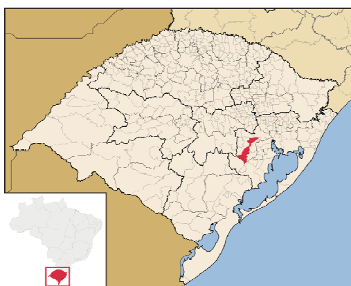
Figura 1- Localização do município de São Jerônimo

A densidade demográfica registra 23,7 hab./km 2 , com Índice de Desenvolvimento Humano (IDH) de 0,79. (IBGE, Censo 2010). As figuras 1 e 2 mostram a localização do município de São Jerônimo.