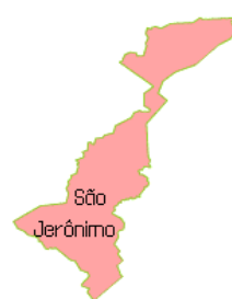
Figura 2 - município de São Jerônimo

De acordo com a história, o município de São Jerônimo até 30 de setembro de 1861, data da sua emancipação política denominava-se Passo das Tropas e fazia parte do município de Triunfo. Entretanto, a conquista definitiva da categoria de município data de 02 de março