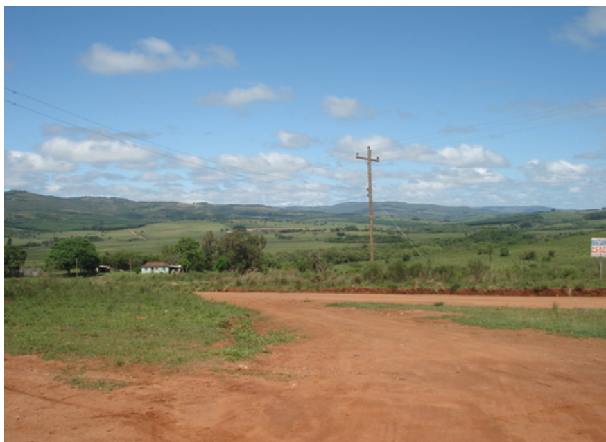
Figura 4 - Vista de Morrinhos