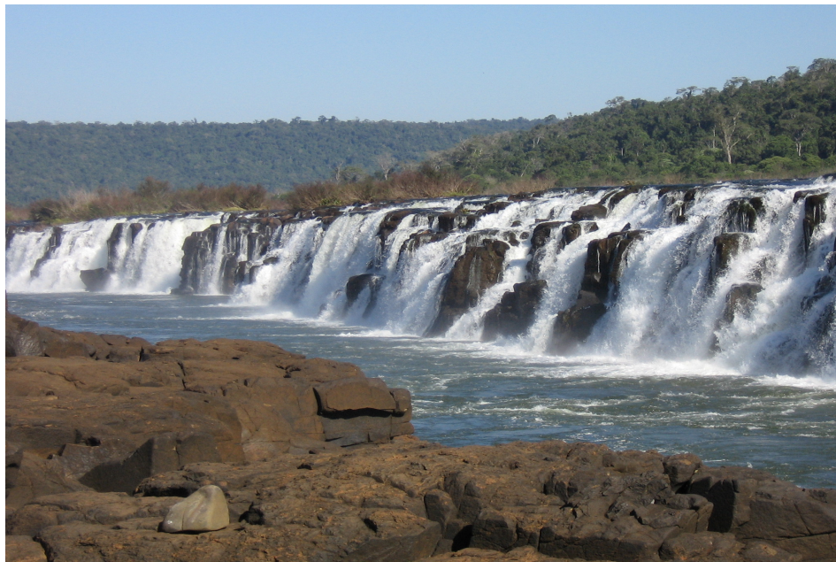
Figura 6: Salto do Yucumã