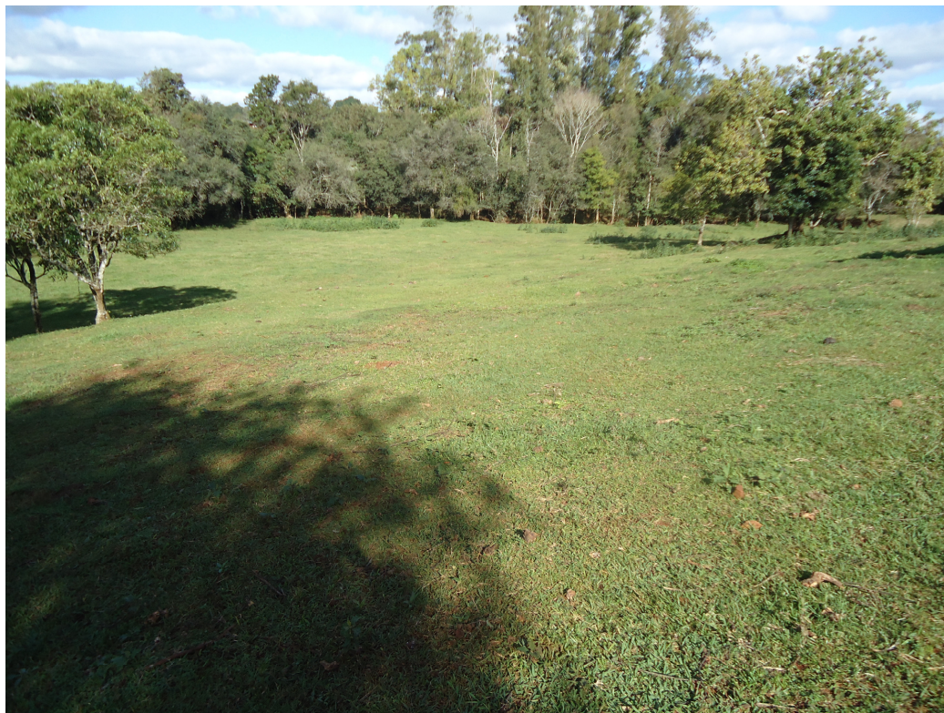
Figura 9: Área de potreiro

Antes da Cooperativa os produtores criavam seus animais extensivamente, em potreiros (fig. 9), produzindo e levando a alimentação do gado de fora para dentro dos mesmos, sendo que a ordenha era realizada manualmente.