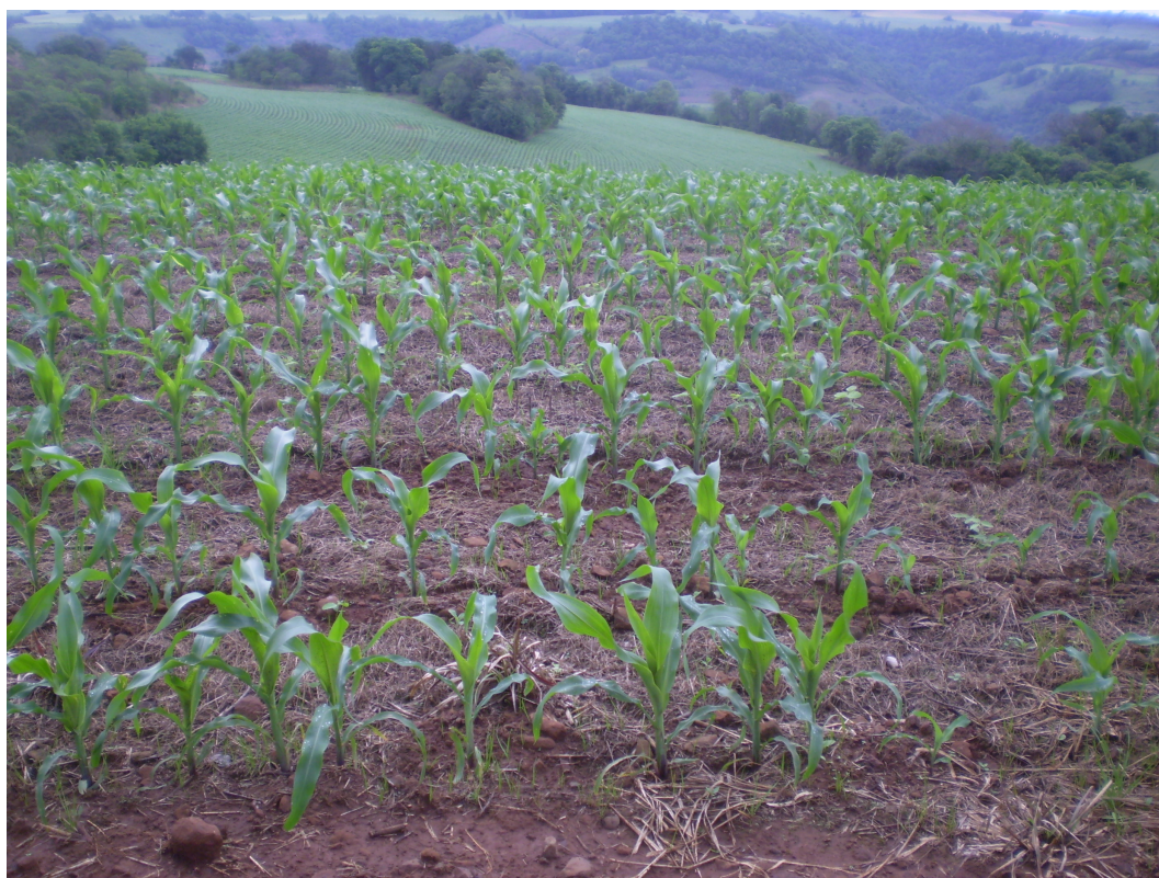
Figura 4 – Área de produção de grãos.