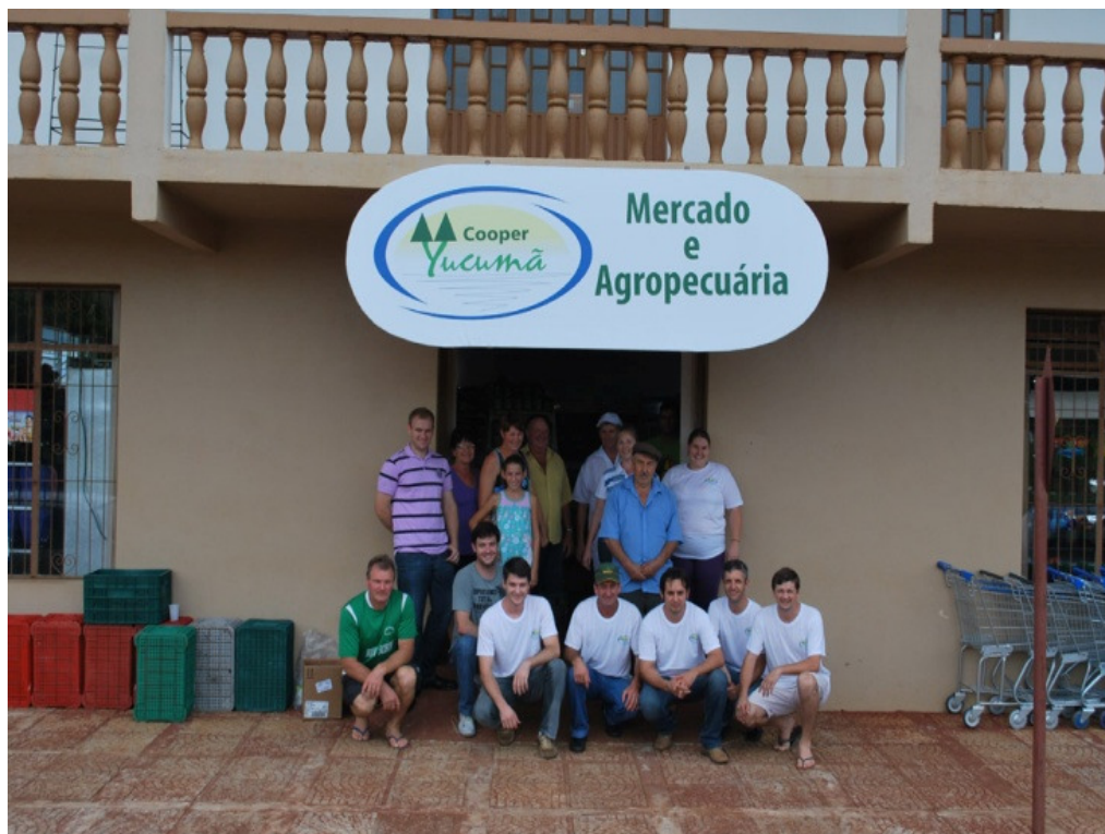
Figura 08: Sede da Cooperyucumã

Na figura 8, vemos a sede da cooperativa, em conjunto com o supermercado e a agroveterinária.