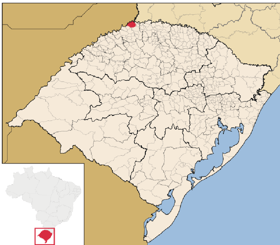
Figura 2: Localização do Município de Derrubadas no Rio Grande do Sul.