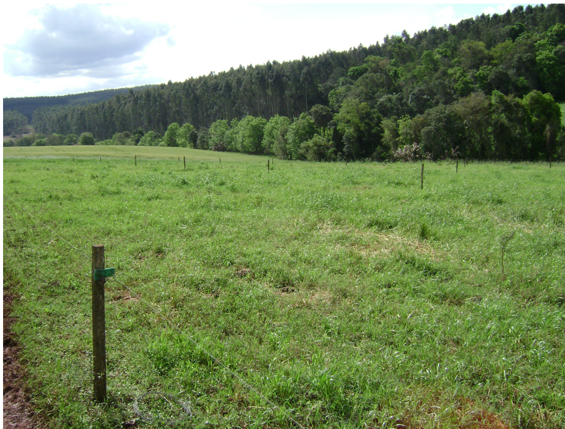
Figura 10: Capim Pioneiro em área com piqueteamento