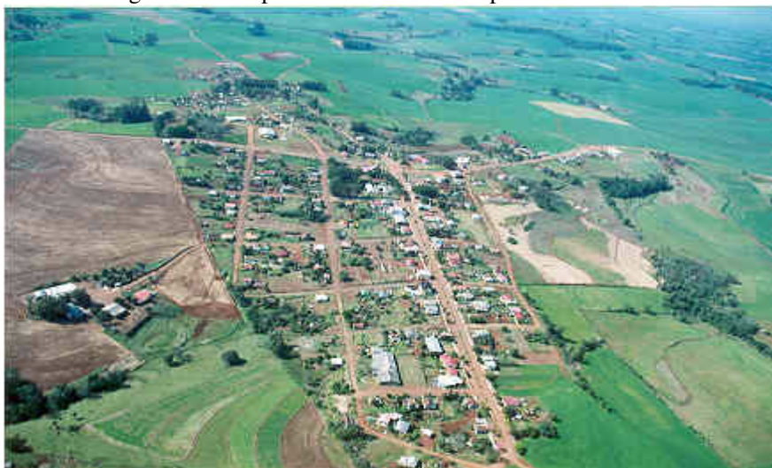
Figura 1: Vista parcial aérea do município de Derrubadas.

Esta pesquisa foi desenvolvida na área geográfica compreendida pelo município de Derrubadas (fig. 1), localizado na região Celeiro do Estado do Rio Grande do Sul. Município onde predominam as pequenas propriedades familiares que tem na atividade leiteira sua principal fonte de renda alternativa.