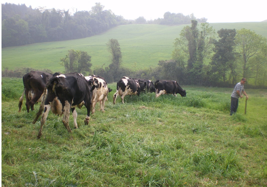
Figura 05: Bovinocultura de leite no município

subsidiada a disposição dos agricultores. A Secretaria Municipal da Agricultura e Meio Ambiente (SMAMA) que conta com três técnicos agrícolas e um inseminador na sede, mais doze postos de inseminação distribuídos no interior do município, que atendem todas as comunidades, é responsável pelo programa de melhoramento genético na bacia leiteira, cujos benefícios e resultados vem melhorando a cada ano, aumentando em muito a produção de leite no município.