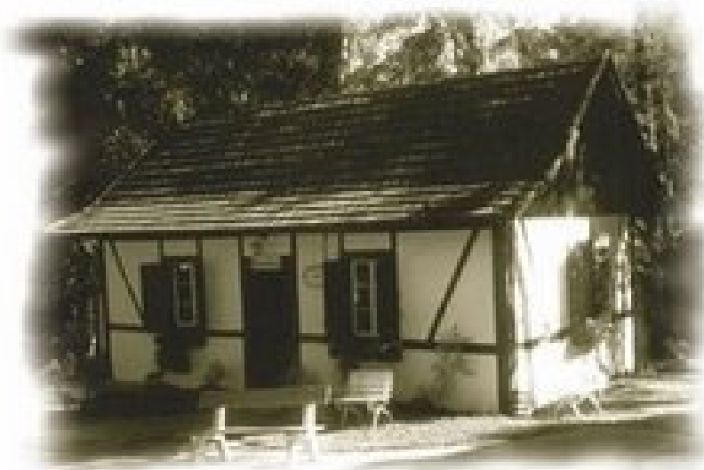
Figura 7: Sede da primeira cooperativa do Brasil, em Nova Petrópolis/RS