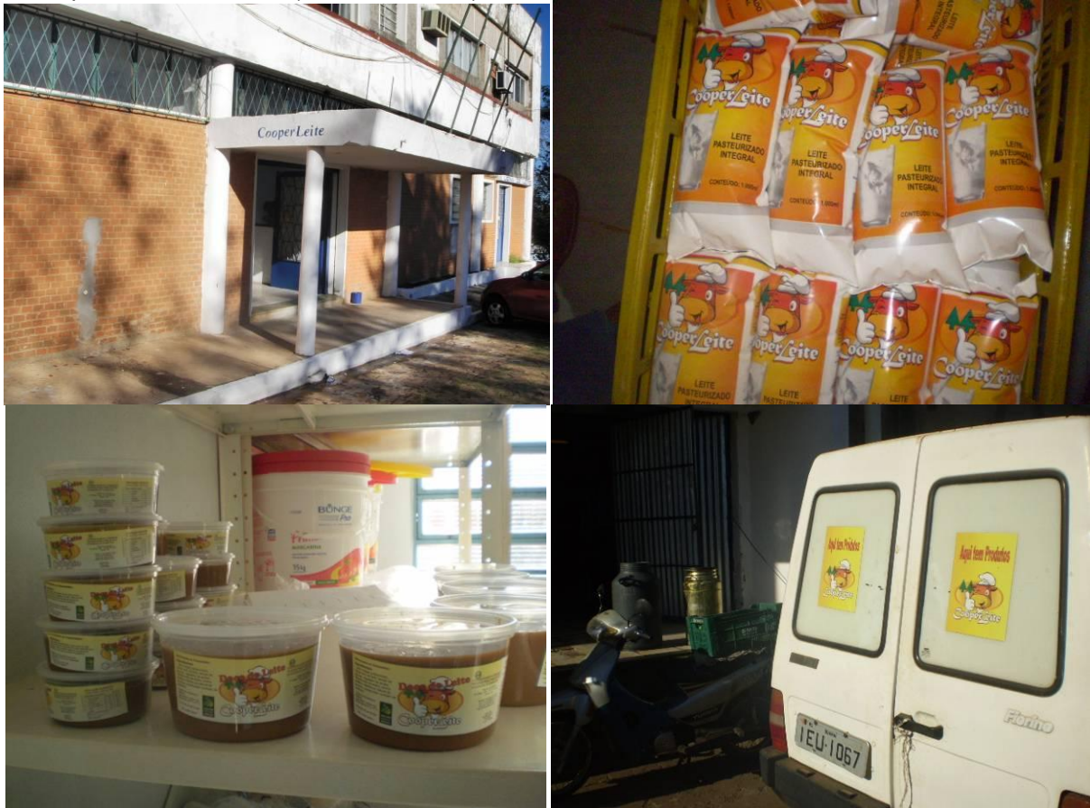
Figura 3: Estrutura e produtos da Cooperativa Mista e Consumo de Pequenos Produtores de Leite do Município de Quaraí LTDA (COOPERLEITE).