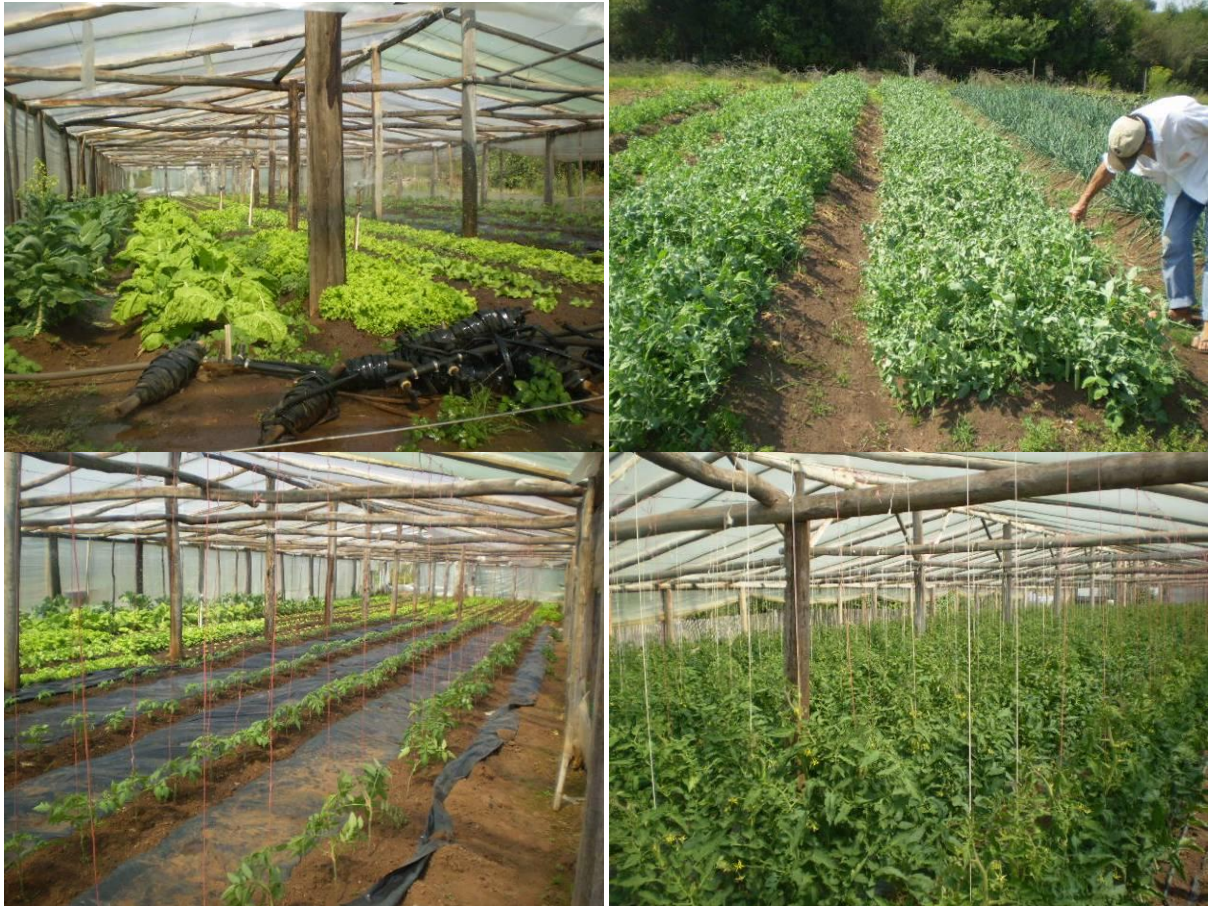
Figura 2 - Produção de hortaliças e de tomates da propriedade do agricultor familiar A.

Para a produção de hortaliças, há três estufas grandes além de canteiros em toda a extensão. Há também criação de animais como gado leiteiro para a produção de leite e queijos, porcos, galinhas, peixes e abelhas para a produção do mel. O abastecimento de água é por meio de uma bomba elétrica com tubulação que capta a água de um açude e leva até a plantação. A Figura 2 ilustra a produção no caso dessa família.