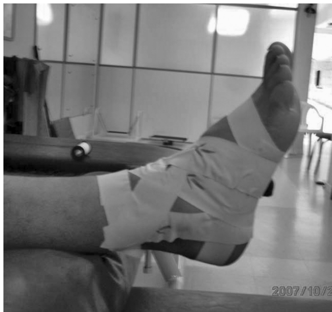
Figura 1. Bandagem funcional de tornozelo.

Bandagem do tipo esparadrapo não-elástico que continha em sua composição borracha natural e óxido de zinco, o que proporciona boa aderência e flexibilidade ao tecido (Figura 1).