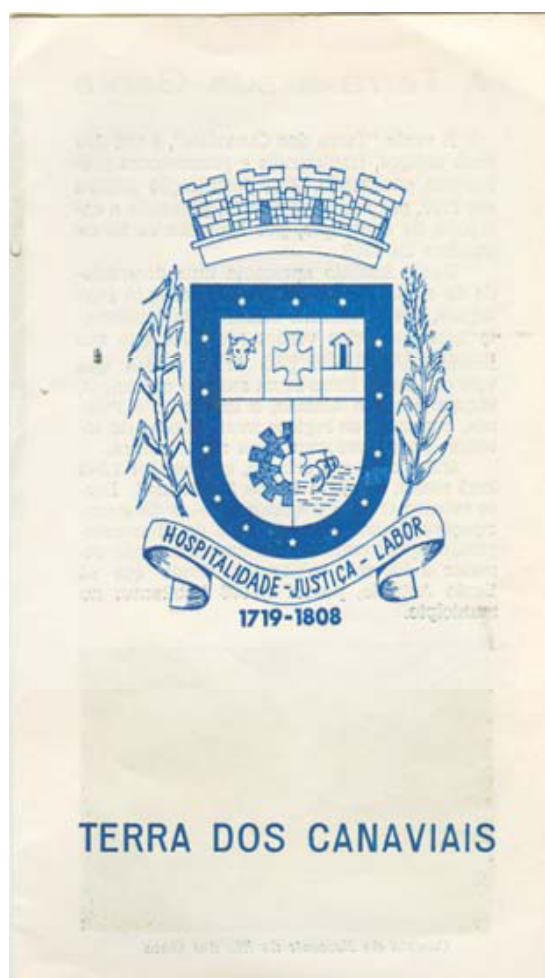
Figura 1: Folder de divulgação do município de Santo Antônio da Patrulha influenciado pela Produção de cana-de-açúcar local – década de 1970.

temas inerentes a este trabalho. Será apresentado o Programa Puro Engenho, tomando como base documentos oficiais e entrevistas às instituições participantes do Programa. Serão apresentadas algumas definições de termos e abordagens de algumas relações com o Programa Puro Engenho com o mercado, o desenvolvimento rural, a agroindústria familiar, melado, rapadura e cachaça. Na terceira secção será apresentada a metodologia utilizada para a realização deste estudo. Uma quarta secção onde serão apresentados os resultados acerca da investigação a respeito dos impactos ocorridos no mercado de melado de cana de açúcar para participantes do Programa Puro Engenho, em Santo Antônio da Patrulha e a interpretação dos mesmos. Na quinta secção serão apresentadas as conclusões a cerca do trabalho desenvolvido. E por fim serão apresentadas as referências deste trabalho.