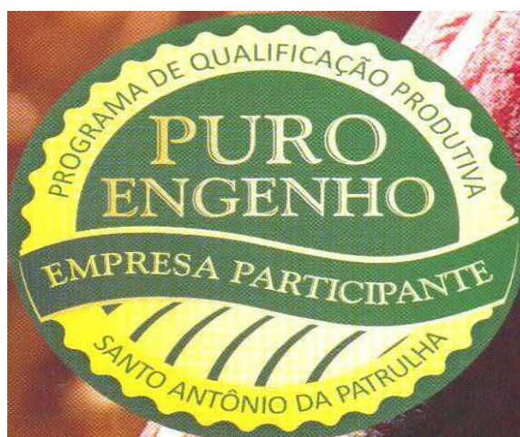
Figura 2: Selo identificador aos produtos que utilizam matéria prima provenientes dos engenhos participantes do Puro Engenho.

Em agosto de 2008 fica então criado o Programa Municipal de Qualificação Produtiva do Melado e Açúcar Mascavo de Santo Antônio da Patrulha, o Puro Engenho, instituído pela Secretaria Municipal de Agricultura com as justificativas das dificuldades de comercialização e de mercado para a produção de melado e açúcar mascavo, a necessidade de desenvolver processos agroindustriais que sejam técnica, social e ambientalmente sustentáveis, a importância econômica e social da produção de derivados da cana de açúcar devido ao grande número de pequenas agroindústrias existentes no município, gerando oportunidades de trabalho à população municipal e a necessidade de adoção de políticas que visem o fortalecimento da atividade agropecuária evitando o êxodo rural.