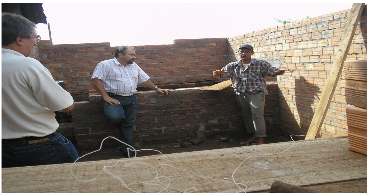
Figura 3: Consultoria do Comitê Gestor ao produtor participante do Programa Puro Engenho.

Em 2009, a Prefeitura Municipal de Santo Antônio concorreu e foi premiada em duas ocasiões pelo Programa Puro Engenho. Primeiro pelo Sindicato dos Auditores Fazendários – SINDAF, o Prêmio Gestor Público 2009, que considerou o Programa como importante agregação de renda à produção e o aumento da venda do melado e do açúcar mascavo através da Nota Fiscal de emitida pelos produtores no Município, agregando também confiabilidade aos seus produtos (CORREIO DE SANTO ANTÔNIO, 2009).