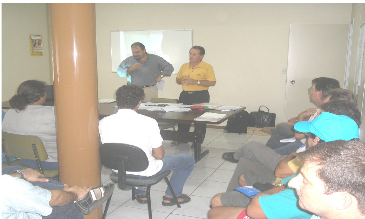
Figura 4: Reunião entre produtores familiares de melado, fabricantes de rapadura e Comitê Gestor do Programa Puro Engenho. Foto Dirceu L. Machado (2007)

As articulações entre entidades, fabricantes de rapadura e produtores também são realizadas pelo Comitê Gestor, que possui internamente, um comitê técnico, formado por um integrante da Emater e outro da Prefeitura Municipal que atendem os produtores em questões sobre adequação das suas estruturas, equipamentos e produção dos derivados de cana de açúcar aos padrões vigentes da legislação.