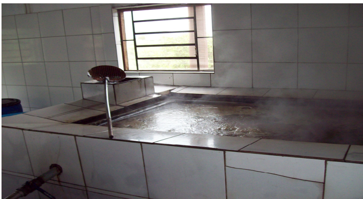
Figura 6: Fabricação de melado de um produtor participante do Programa Puro Engenho. (2011)

deve ser colhida com uma antecedência máxima ao seu processamento de 24 horas. Através de um conjunto de moendas o seu caldo é separado o bagaço da cana, então este deve ser filtrado para separar o máximo de impurezas possíveis, como o bagacilho, terra, palhas. O caldo deve ser levado ao fogo para a sua concentração. Normalmente aqui os meladeiros da região possuem tachos de ferro que variam de 350 a 500 litros, em fornalhas a fogo direto. Já, no tacho, ocorre a limpeza térmica, onde o caldo atinge 80°C e as impurezas floculam. Estas devem ser retiradas antes que ocorra o fervimento do caldo, pois se isto ocorrer as impurezas se misturam sendo impossível a sua retirada e resultando em um produto sem qualidade. Esta operação deve acontecer com a utilização de uma espumadeira com furos de 2mm.