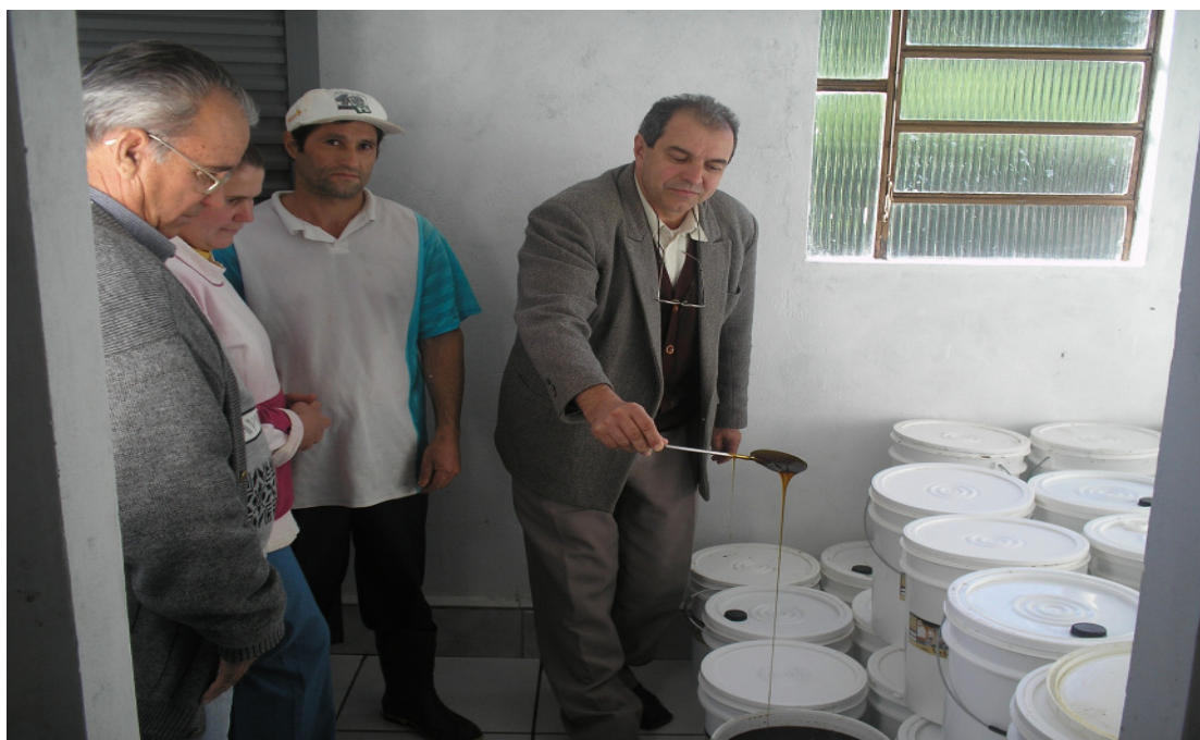
Figura 5: Fabricante de rapadura analisando qualidade do melado de produtor participante do Programa Puro Engenho.