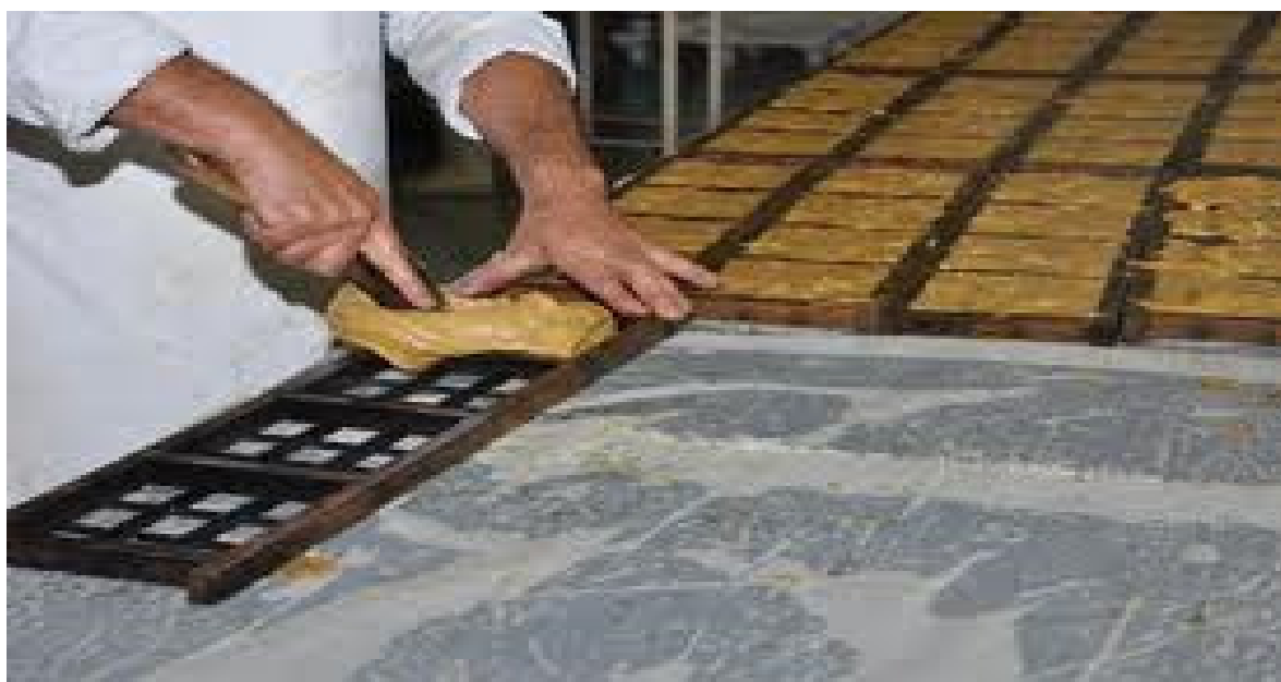
Figura 7: Fabricação da rapadura tradicional de Santo Antônio da Patrulha

Para Cesar e Silva (2003) “rapadura é o melado com concentração entre 82 e 85º Brix que se solidificam em blocos após o seu resfriamento”.