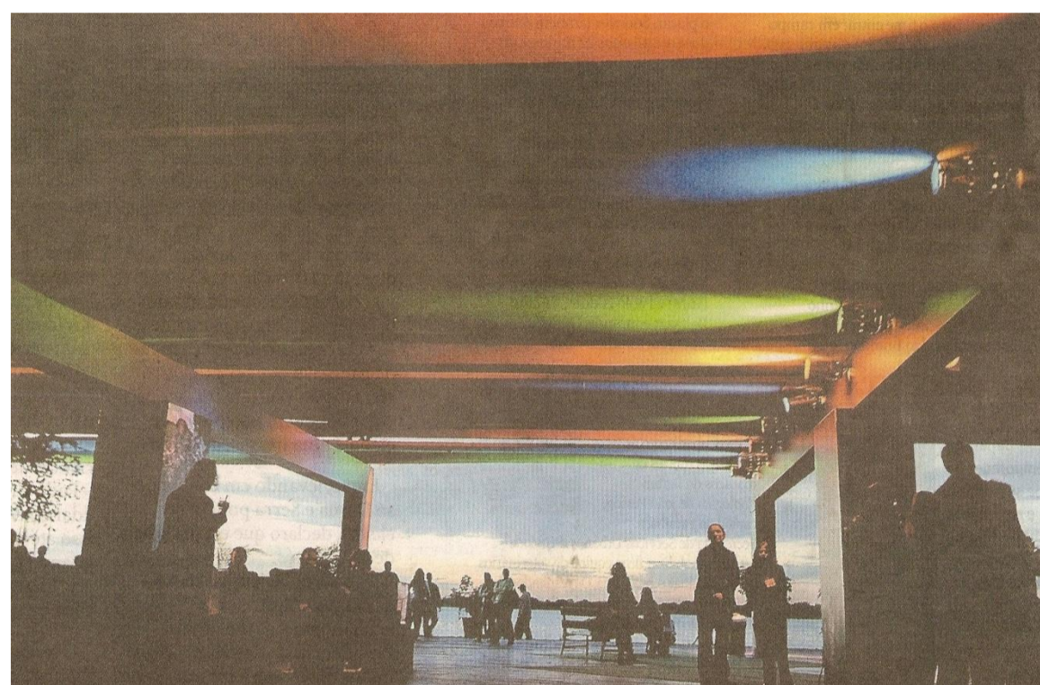
Ilustração 1: O campo na cidade (Cais do Porto)

O jornal impresso como fonte de informação sobre a cidade vincula-se ao projeto Porto Alegre Imaginada e caracteriza o jornal impresso, uma fonte de informação sobre Porto Alegre, a partir de reportagens veiculadas pelo jornal Zero Hora.