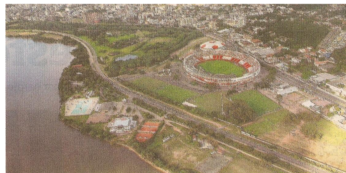
Ilustração 2: Porto Alegre anuncia para agosto obra na Beira-Rio

Constitui na coleta de matérias publicadas no Zero Hora entre os meses de maio a dezembro de 2010, que possuem imagens visuais. Realizou-se a análise de conteúdo, verificando o número e conteúdos informativos das reportagens, os quais foram codificados por "temas sobre a cidade": Situação das ruas; Cultura; Monitoramento policial; Espaços públicos; Tempo; Esporte; Parques e praças; Monumentos; Obras; Saúde; Violência. Identificou-se quais os principais espaços que ganharam maior visibilidade nas notícias veiculadas pelo meio.