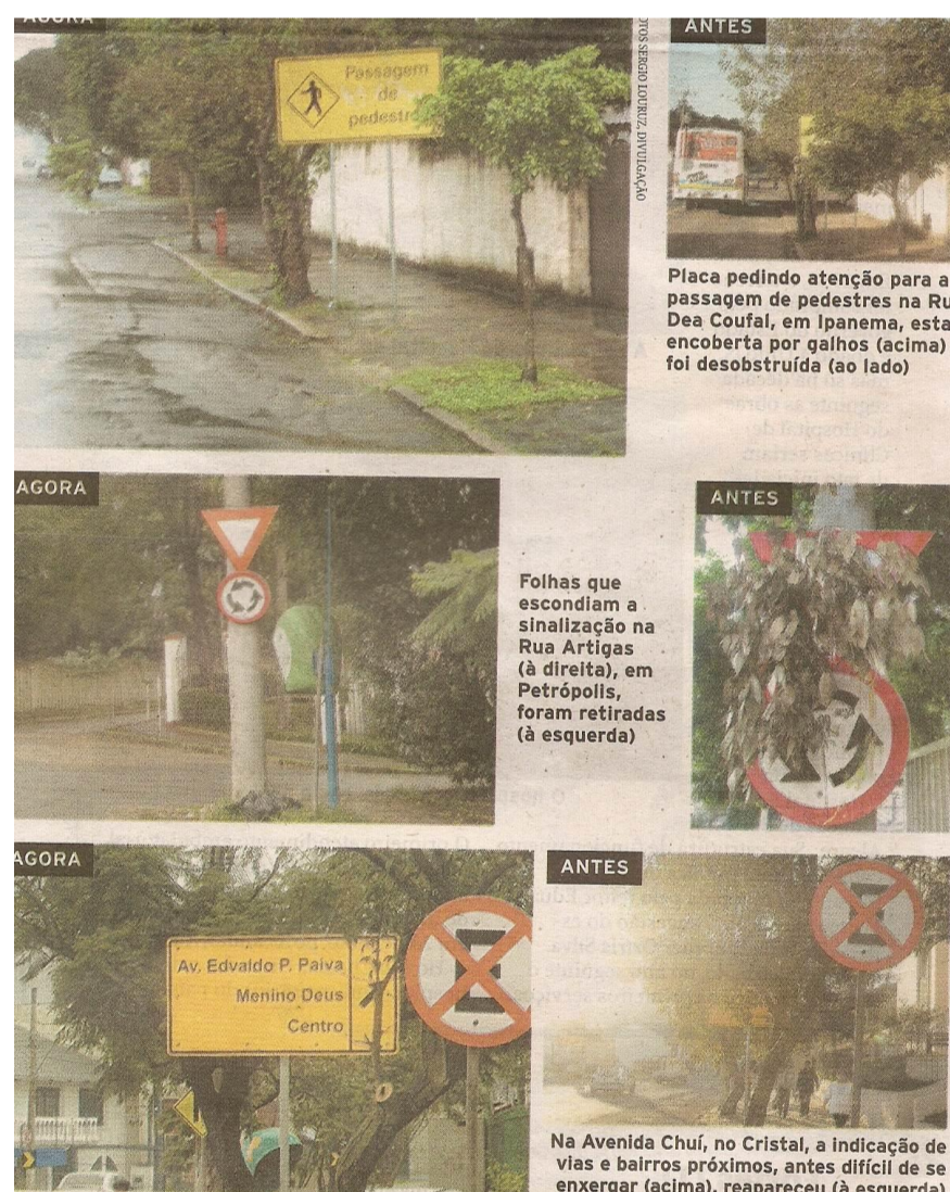
Ilustração 3: Força-tarefa poda árvores que atrapalhavam o trânsito

Analisar as informações veiculadas no jornal Zero Hora sobre Porto Alegre e como a cidade se constitui uma fonte de informações sobre si mesma.