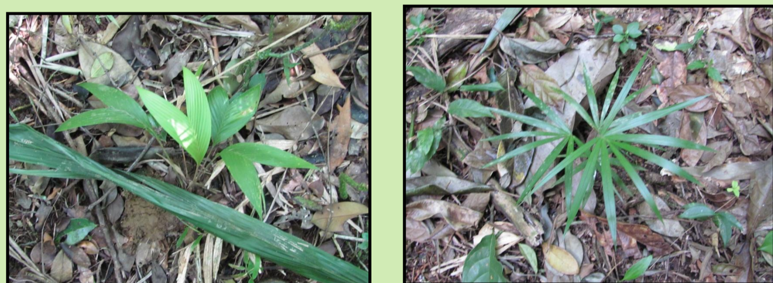
Figura 1: Plântula de Geonoma gamiova . Figura 2: Plântula de Euterpe edulis .

A fim de complementar o estudo fenológico que vem sendo realizado com as espécies Bactris setosa , Euterpe edulis , Geonoma gamiova , Geonoma schottiana , Syagrus romanzoffiana no remanescente florestal de Dom Pedro de Alcântara, foram realizados seus respectivos levantamentos demográficos. Com isso, é possível determinar a estrutura populacional de cada espécie.