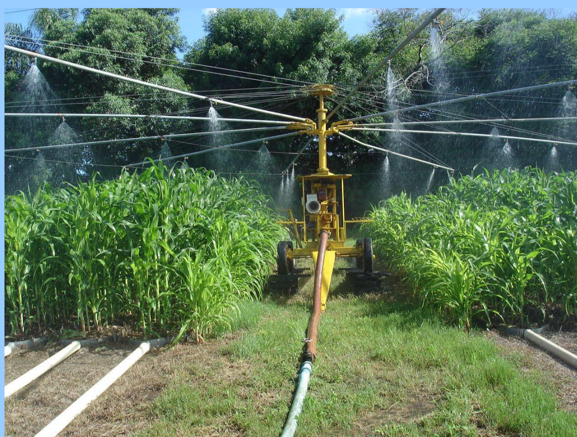
Simulador de chuvas de braços rotativos

Aos 45 dias após a semeadura da cultura do milho aplicou-se chuva simulada com intensidade de 120 mm h -1 durante 90 minutos, em parcelas a campo sob diferentes sistemas de manejo do solo: preparo convencional (PC) e plantio direto (PD). Em cada sistema de manejo foram aplicadas quatro repetições dos tratamentos de adubação com adubação mineral (AM), adubação orgânica com composto de lixo (CL), adubação orgânica com dejetos de suínos (DS) e tratamento testemunha (TEST). Durante a aplicação das chuvas simuladas foram feitas amostragens de escoamento superficial para determinar as taxas de escoamento e de infiltração de água no solo, bem como as perdas totais de água e os coeficientes de enxurrada.