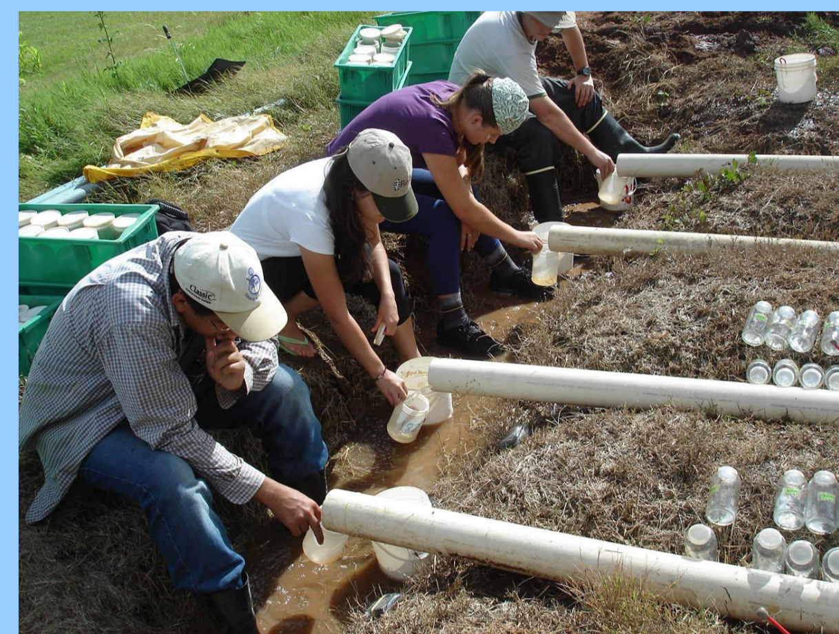
Coletas das amostras para determinação das perdas de solo, água, e taxas de infiltração.