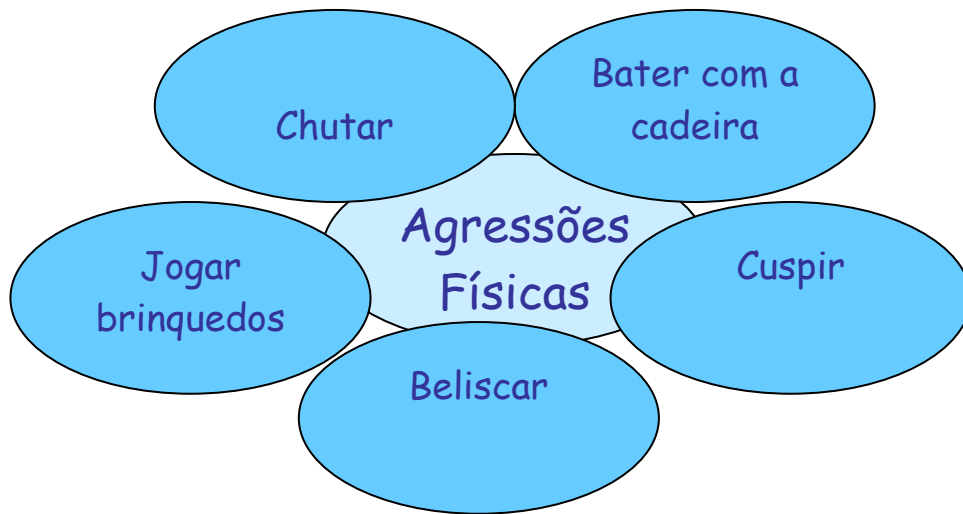
Figura 3 – Agrupamento “Agressões Físicas”