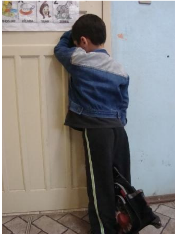
Figura 2 – “Esquina”

naquela situação até o final da aula. Enquanto eu conversava, tentava acalmá-lo, atender os outros alunos, que por sinal não se abalaram e continuaram brincando sem se incomodar com a cena de desespero do colega. Sem ter mais o que fazer, já que não quis chamar auxílio de alguém da secretaria, fiquei tentando amenizar o fato até que chegou a hora de irmos pra casa.