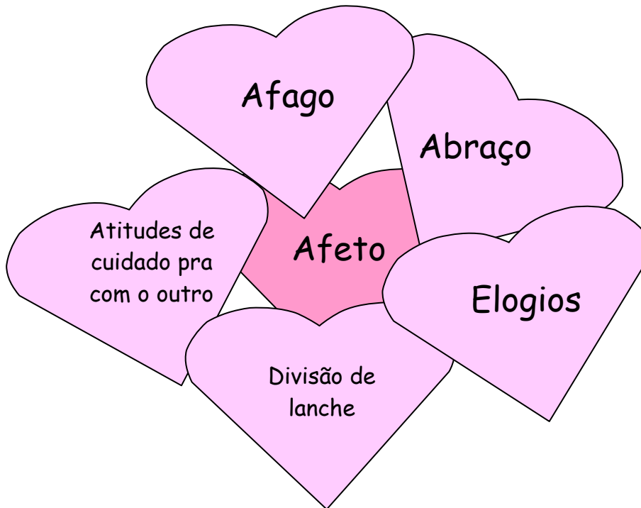
Figura 5 – Agrupamento “Afeto”