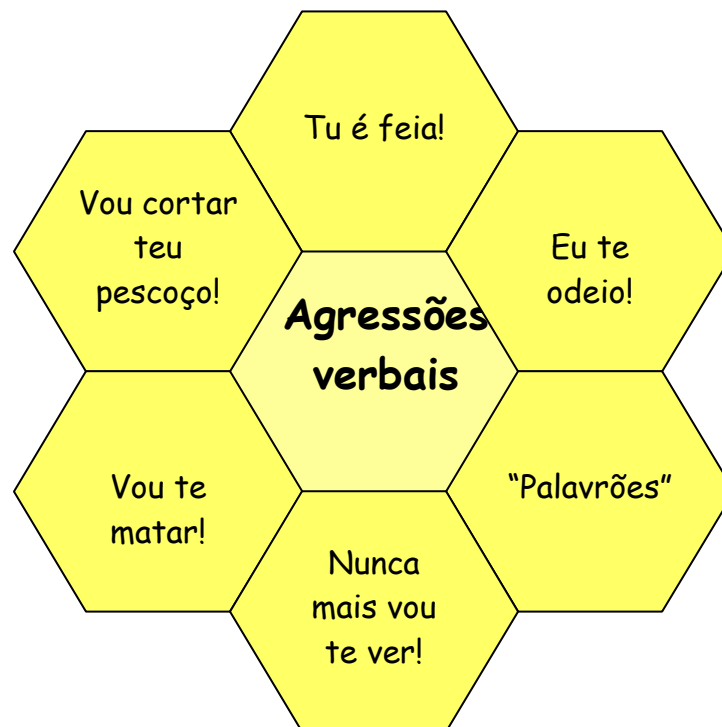
Figura 4 – Agrupamento “Agressões Verbais”