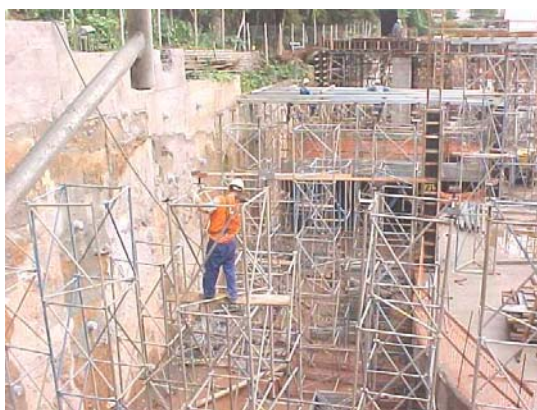
Figura 5 - Atividade de montagem e desmontagem de torres de escoramento que gerou quase-acidentes de retorno positivo e negativo.

Alguns quase-acidentes de resposta positiva com ação dos operários retomando o controle podem apresentar violação de regras de segurança - vale salientar que as violações também estão presentes em muitos eventos com retro-alimentação negativa. Embora esses casos sejam ambíguos, pois são indicativos simultâneos de sucesso e fracasso na gestão da segurança, eles foram classificados como de resposta positiva para enfatizar a capacidade de adaptação dos envolvidos, os quais responderam eficazmente às consequências de falhas gerenciais bastante distantes do cenário do evento. São citados dois exemplos desses casos, sendo que o primeiro envolveu a retomada de controle pelo próprio trabalhador e o segundo pela equipe.