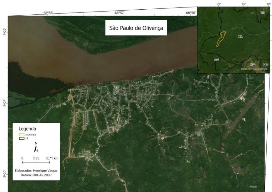
Mapa 3 - Localização geográfica do município de São Paulo de Olivença, Amazonas, Brasil.

Trouxemos para esta reflexão dois municípios dos 16 que nos propusemos a atuar, para demonstrar a diversidade e, ao mesmo tempo, a nossa vontade em não deixar ninguém para trás. Esses municípios dialogam com o que trazemos sobre V. 22 N° 2, setembro, 2024 _____ RENOTE DOI: