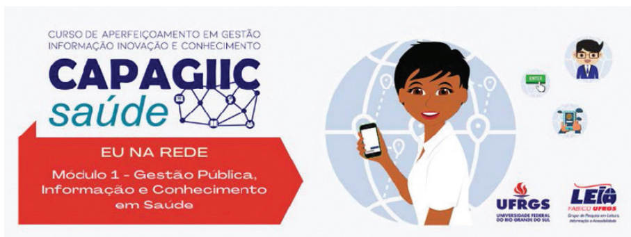
Figura 6 – Módulo 1 “Eu na Rede”

No 1º semestre, realizado no período de março a julho de 2021, com carga horária de 250 horas, foi desenvolvido o 1º Módulo – “Eu na Rede”. (Figura 6).