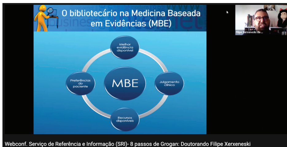
Figura 14 – Webconferência do Curso de Aperfeiçoamento CAPAGIIC-Saúde

Ao longo do Curso, foram realizadas, via plataforma Zoom, várias webconferências, as quais contaram com renomados profissionais de diferentes áreas de atuação na pesquisa e na saúde. Ao final das exposições, os participantes tiveram a oportunidade de dialogar diretamente com os palestrantes. A Figura 14 é ilustrativa de uma das webconferências realizadas ao longo do Curso.