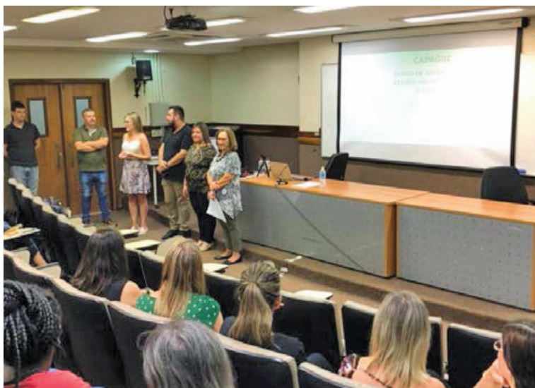
Figura 3 - Abertura e apresentação dos integrantes da Equipe de Trabalho

UFRGS, a capacitação das equipes pedagógica e tecnológica, com o objetivo de trabalhar as diretrizes para o planejamento das unidades e da elaboração de conteúdos, objetos de aprendizagem e materiais do Curso. (Figura 3).