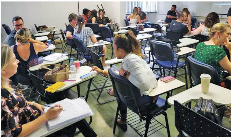
Figura 4 - Coordenação do CAPAGIIC e conteudistas na Capacitação