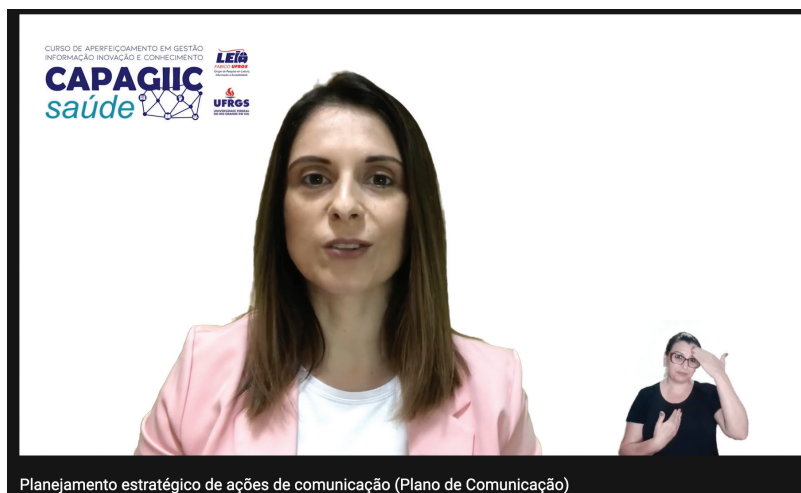
Figura 13 – Videoaula produzida para o Curso de Aperfeiçoamento CAPAGIIC-Saúde

A cada conteúdo, além do texto-base, uma videoaula era disponibilizada, sempre atendendo aos critérios de acessibilidade, de modo a apresentar legendas e tradução em Libras, conforme ilustra a Figura 13.