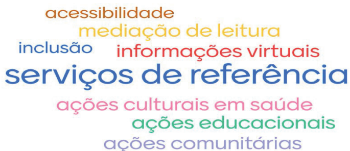
Figura 12 – Nuvem de Palavras do Módulo “Voz da Rede”

Foi o momento de dar voz à rede, por meio de estudos e discussões sobre serviços de referência e informação presencial e virtual em saúde, acessibilidade informacional, inclusão, mediação de leitura e ações culturais, educacionais e comunitárias em saúde. (Figura 12).