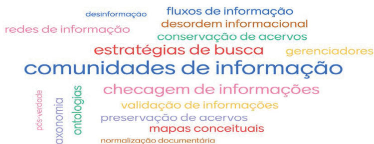
Figura 9 – Nuvem de Palavras do Módulo “Nós na Rede”