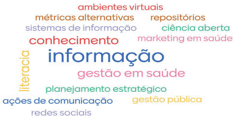
Figura 7 – Nuvem de Palavras do Módulo “Eu na Rede”