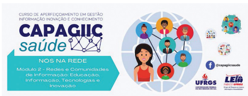
Figura 8 – Módulo 2 “Nós na Rede”

Entre agosto de 2021 e janeiro de 2022 foi desenvolvido o 2º Módulo, também de 250 horas, direcionado para o “Nós na Rede”. (Figura 8).