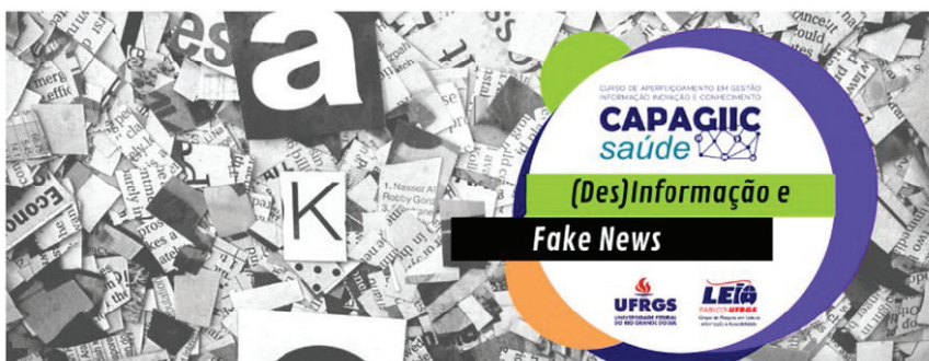
Figura 10 – MOOC “(Des)Informação e Fake News”

No mês de fevereiro de 2022, foi realizado um MOOC (Curso Online Aberto e Massivo) intitulado “(Des)Informação e Fake News”, cujos conteúdos versaram sobre os conceitos de pós-verdade, desinformação, hiper-informação, desordem informacional, deep fake news e práticas de fact checkinhg , entre outros. (Figura 10).