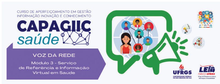
Figura 11 – Módulo 3 “Voz da Rede”

Finalizado o MOOC, no período de março a julho de 2022 teve início o terceiro módulo do CAPAGIIC-Saúde, também com 250 horas de duração (Figura 11).