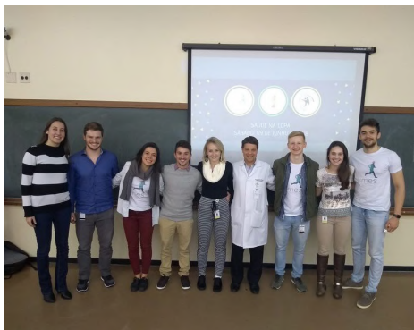
Registros de aulas ministradas aos ligantes.