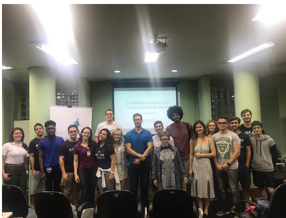
Atividades da LIMES.