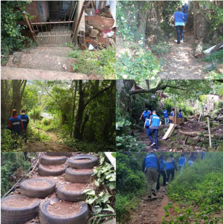
Figura 5. Limitações à acessibilidade de moradores do território.