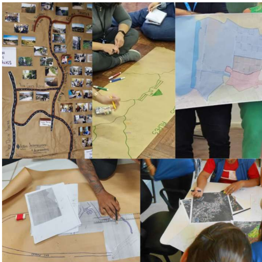
Figura 7. Representação dos territórios adscritos das Unidades de Saúde em momento de concentração com estudantes sobre o tema território e territorialização.