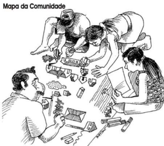
Figura 6. Representação do território.

Uma das ferramentas utilizadas é a construção/representação da comunidade por meio de mapas e maquetes, que servem para planejar, discutir e analisar a informação visualizada (Figura 6). Pode ser elaborada sobre papel ou qualquer outro tipo de material, podem ser mapas de recursos naturais, mapa sociais, mapa da comunidade, mapa vivo. Como a dinâmica ocorre na sala de aula com todo o grupo a proposta é a construção de um mapa da comunidade, onde é demonstrado a situação atual da comunidade em relação a suas potencialidades, suas limitações, condições de vida, estrutura social, tipo de ocupações, recursos naturais, uso do espaço, serviços, etc. (Verdejo, 2006).