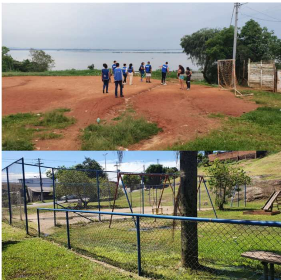
Figura 2. Vista geral de equipamentos de lazer no território.