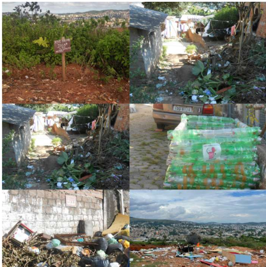
Figura 4. Situações de resíduos no território.