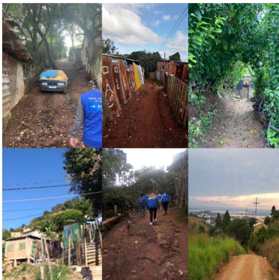
Figura 1. Detalhe do acesso a moradias no território.