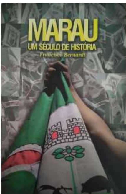
Figura 5 - Capa do livro "Marau: um século de história"