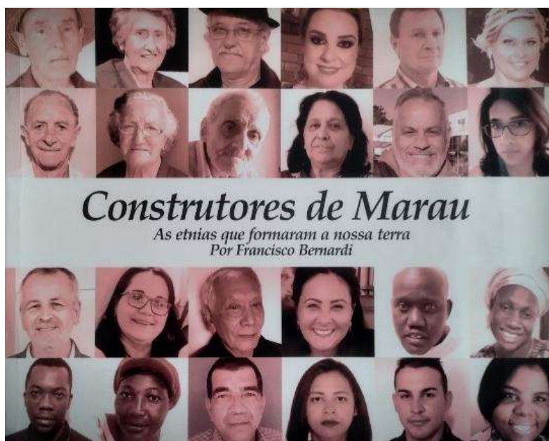
Figura 6 - Capa do livro "Construtores de Marau: as etnias que formaram a nossa terra"

Em “Construtores de Marau: as etnias que formaram a nossa terra”, o último livro lançado por Bernardi e o último a ser analisado neste trabalho, não há a mesma divisão cronológica da história de Marau: ele é dividido entre as histórias de cada uma das ditas etnias construtoras da cidade. Assim, o marco que separa a primeira parte da segunda não é a emancipação do município, mas sim a separação entre o fluxo migratório que ocorreu no início do século XX e o que ocorreu no início do século XXI. A escolha de estruturar o livro dando um capítulo para cada etnia permitiu uma expansão do conteúdo para além da história dos descendentes de imigrantes italianos, por mais que, no capítulo dedicado a eles, muito dos livros anteriores tenha se repetido.