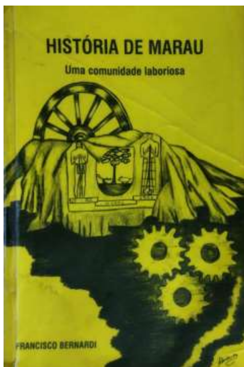
Figura 2 - Capa do livro "História de Marau, uma comunidade laboriosa"

Capa do livro onde se vê um mapa do Brasil e o brasão de armas de Marau, com elementos como uma roda d'água e rodas dentadas, representando, provavelmente, a visão de desenvolvimento industrial da cidade presente no livro.