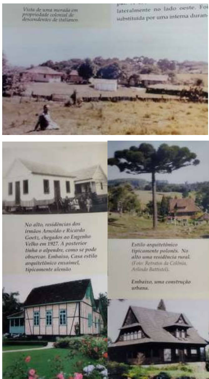
Figura 10 - Páginas do "Construtores de Marau" que retratam residências de brancos

Nas imagens, respectivamente das páginas 32, 52 e 68, vemos a forma que Bernardi retrata positivamente as habitações brancas.