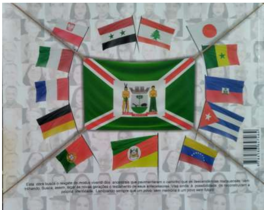
Figura 8 - Quarta-capa de "Construtores de Marau"