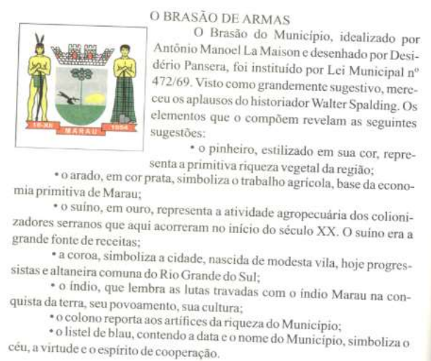
Figura 1 - Brasão de armas de Marau

Descrição do brasão de armas do município presente em uma das fontes. Nele, podemos encontrar elementos similares aos do hino; colono e indígena são representados lado a lado, mas é possível perceber na descrição dada pelo autor.