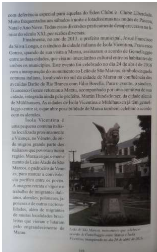
Figura 12 - Página do "Marau: um século de história" que fala sobre o acordo de Gemellaggio

Página do “Marau, um século de história”, onde Bernardi fala sobre o acordo de Gemellaggio entre Marau e Ísola Vicentina, assinado em 2013. Esse acordo torna as duas “cidades irmãs”, facilitando o intercâmbio de seus cidadãos entre si, e em um segundo plano com a cidade alemã de Mühlhausen, que tem o mesmo acordo com Isola Vicentina. Foi mais uma forma de o poder público, através da prefeitura, fortalecer e propagar o ideal de um orgulho italiano branco na cidade.