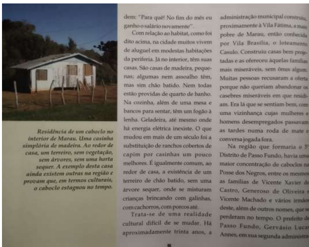
Figura 9 - Página do "Construtores de Marau" que retrata a residência de um "caboclo"

Os imigrantes haitianos e senegaleses não colaborariam para o desenvolvimento de Marau: apenas ficariam na cidade sendo “assistidos por instituições locais”. É assim que “Construtores de Marau”, mesmo com as melhores intenções, cai em muitas armadilhas, especialmente no que diz respeito à miragem da branquitude não-marcada (Frankenberg, 2004), como veremos em trechos dos capítulos sobre as etnias brancas europeias. Entretanto, iniciaremos a análise partindo do elemento relacional da branquitude: as categorias que formulam a identidade branca se estabelecem na oposição às categorias consideradas não brancas. Para Bernardi, os grandes representantes de tudo que a branquitude não é são os caboclos. O capítulo em que isso mais se expressa, “Caboclos”, é abertamente racista, como é possível perceber no tom ao qual se refere às diferenças da forma de vida destes com a dos descendentes de imigrantes europeus: