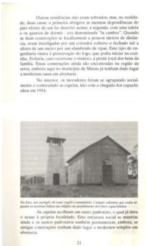
Figura 4 - Página do "História de Marau" com fotografia de capela católica

Aqui, Bernardi atribui valor à dedicação dos descendentes de italianos para com a religião católica. É uma das características que Zanini e Santos (2009) encontraram nos grupos de imigrantes que pesquisaram, sendo que o aspecto civilizatório do cristianismo é aqui usado para distinguir um grupo (os descendentes de italianos) do outro (os “brasileiros”). A construção adiantada de um capitel no centro do núcleo urbano é destacada na narrativa da história da cidade, e a necessidade de apontar para o protagonismo dos descendentes de imigrantes nesse processo em contraste com a ausência de práticas religiosas dos “brasileiros” demonstra uma hierarquização entre os grupos (quem seria mais valoroso do que alguém que lasca à mão as tábuas que construirão seu primeiro templo?).