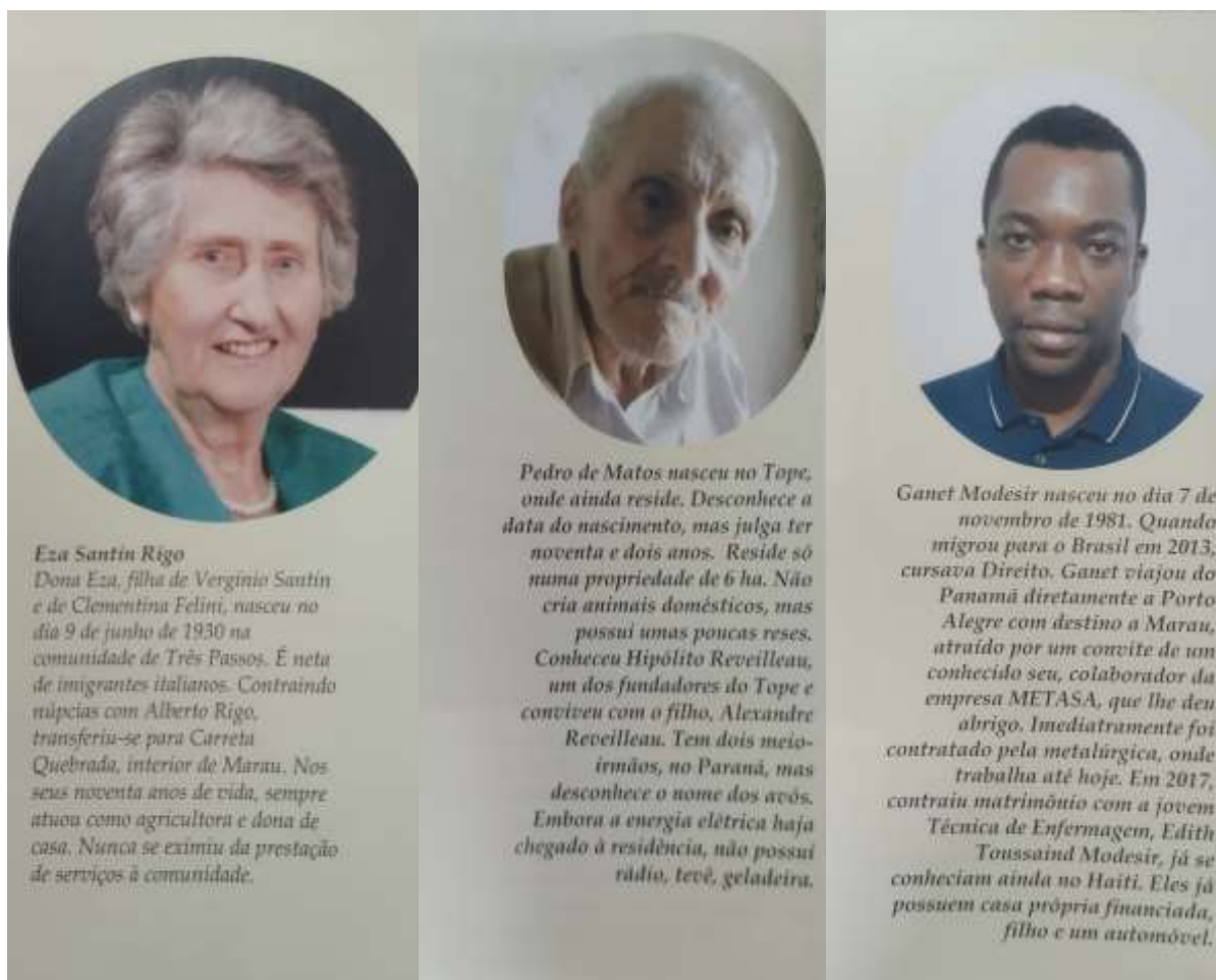
Figura 7 - Representantes escolhidos por Bernardi para representar as etnias italiana, "cabocla" e haitiana, respectivamente

Imagens de representantes de italianos (p. 15), caboclos (p. 82) e haitianos (p. 114), para ilustrar a forma com Bernardi retrata seus personagens. Veremos na análise que significados podem ser interpretados comparando as diferentes descrições.