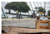
Para repensar a infraestrutura urbana