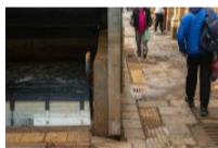
Carta aos leitores | 05.06.24