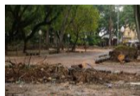
Sobre inundações, ou a importância do urbanismo