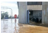
Receita catastrófica: desmonte do Estado com mudanças climáticas