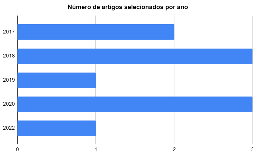
GRÁFICO 1 – DISTRIBUIÇÃO DOS ARTIGOS SELECIONADOS CONFORME O ANO DE PUBLICAÇÃO

Foram buscados artigos no recorte temporal de 10 anos (publicados entre 2013 e 2023) e um total de 10 artigos foram incluídos na amostra. Os anos de publicação da amostra ficaram distribuídos da seguinte maneira: dois artigos no ano de 2017; três artigos no ano de 2018; um artigo no ano de 2019; três artigos no ano de 2020 e um artigo no ano de 2022. Esta distribuição pode ser vista no gráfico 1.