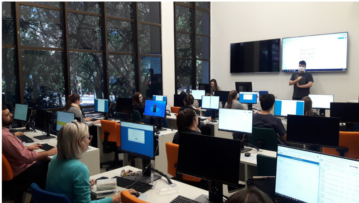
Laboratório de Informática atualizado e reinaugurado em 2019 com recursos da Parceria Público-Privada