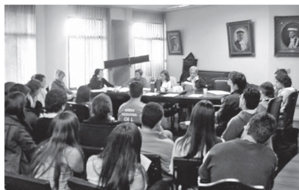
Mobilização dos estudantes de Medicina para discussão da reforma curricular que estabelecia 24 meses de Internato em 2006