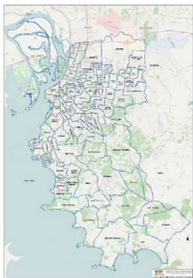
Mapa dos bairros de Porto Alegre