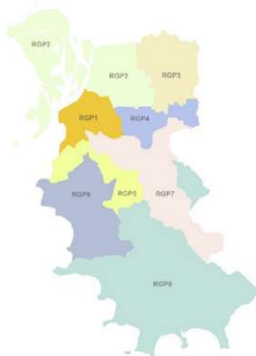
Mapa das regiões de planejamento de Porto Alegre