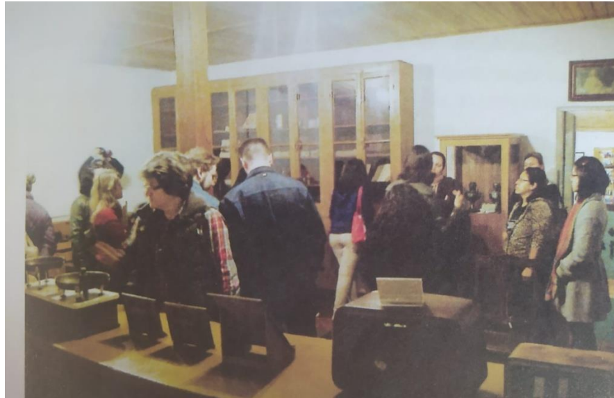
Figura 7 – Participantes do Lombatur visitam o MCLP/MFR

Lombatur (Figura 7), que tem como meta aproximar o público de seu patrimônio material e imaterial.