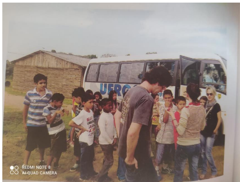
Figura 6 - Participantes do Lombatur visitam o bairro

Para Faria (2016, p. 107), trata-se de um projeto iniciado a partir da constatação dos moradores do bairro em que se situa de que o Museu não se identificava com seu território. “Em um exercício prático e reflexivo, o desafio se tornou o de estimular os sujeitos a dialogarem sobre o espaço, as memórias compartilhadas, os silêncios, os desafios e esperanças, a partir do que o elegeram como patrimônio cultural.”