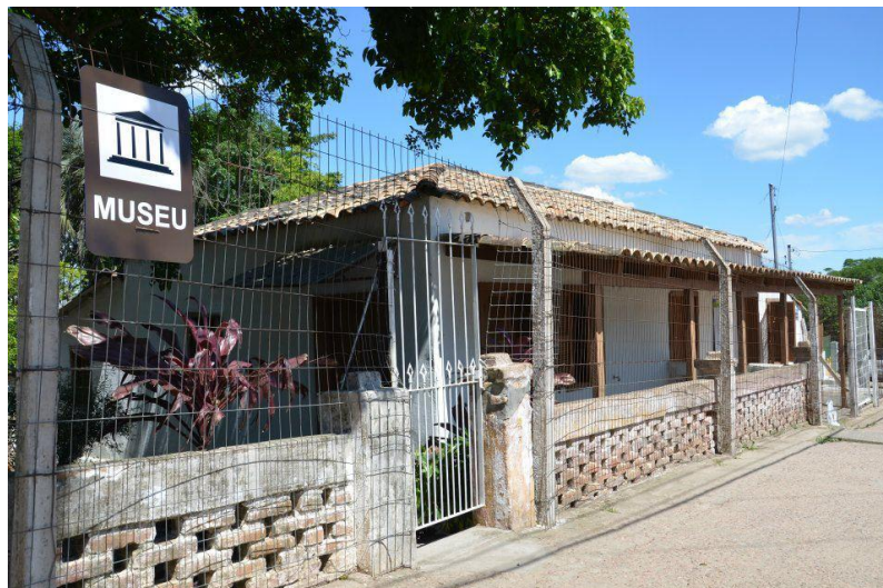
Figura 2 –Vista lateral do prédio do Museu, antigo armazém Vencedor