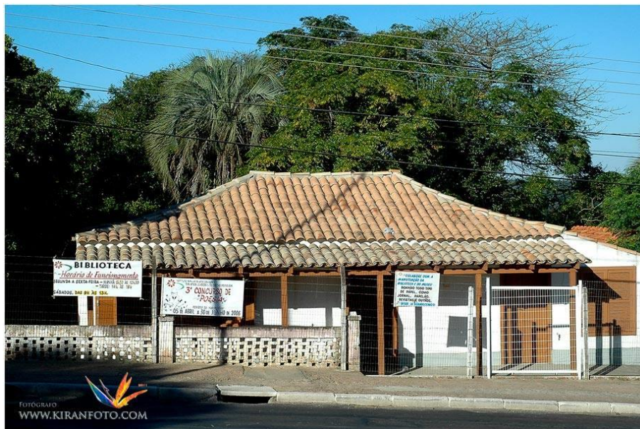
Figura 1 – Imagem do prédio do Museu, antigo armazém Vencedor