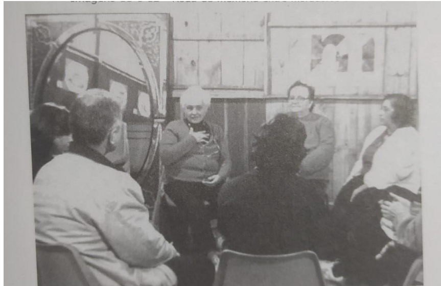
Figura 4 – Roda de Memória realizada no MCLP/MFR