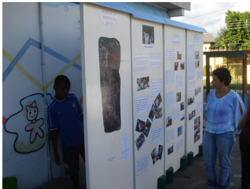
Figura 5 – Museu de Rua no bairro Lomba do Pinheiro

Durante muitos anos, as associações de moradores, cumpriram o importante papel de cobrar do poder público municipal a implantação e manutenção de serviços sociais básicos como abertura e manutenção de vias urbanas, criação de linhas de transporte coletivo que contemplasse as demandas da população das vilas, instalação de rede elétrica residencial, construção de redes de água e esgoto, escolha de locais para construção de postos de saúde. Enfim, todo um processo de construção de estrutura, necessária e essencial para melhorar a vida da população do bairro, contado, através de imagens, acompanhado por textos, nos painéis do acervo dos Museus de Rua, como se verifica na Figura 5.