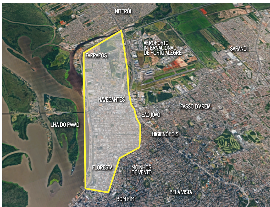
Figura 1 – Mapa com delimitação do 4º Distrito de Porto Alegre

de ações de investimento hoje e caracterizando-se pela sua proximidade ao Centro Histórico e ao Moinhos de Vento, bairro de classe média-alta da cidade que avança sobre o Floresta. Partindo dessa delimitação territorial, podemos perceber que as iniciativas e os empreendimentos existentes nos bairros que compõem essa região, entre os anos de 2008 e 2018, são atravessados por empreendimentos imobiliários e de agentes como artistas, gestores e idealizadores da formação de um distrito criativo, sendo o bairro Floresta um bairro predominantemente de serviços (Marx; Araujo; Silva, 2020).