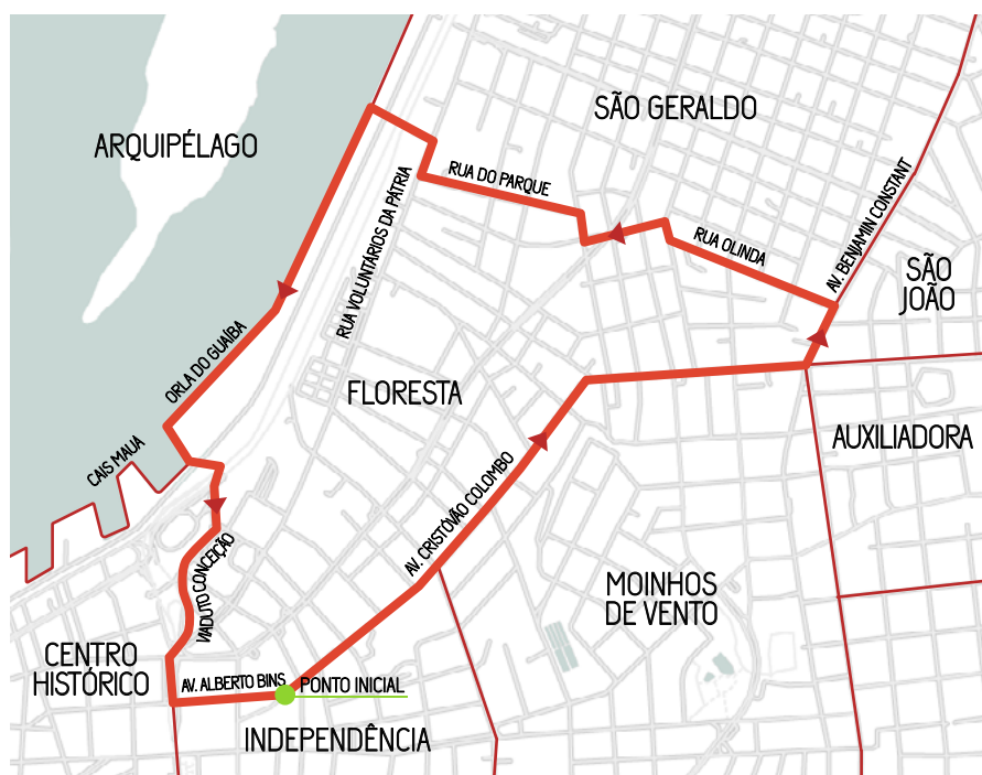
Figura 2 – Mapa com espacialização dos limites do bairro Floresta (2016)

Em um segundo momento, convidamos, para caminhar conosco, quatro pessoas com diferentes tipos de vínculos e atuação no bairro. Considerou-se o critério da pluralidade de atores sociais que vivem e atuam no Floresta, o que nos possibilitou aprofundar o conhecimento acerca das territorialidades do “Alto Floresta” e “Baixo Floresta”, nas suas especificidades, alianças e conflitos. Os atores sociais foram identificados através da rede de contatos do grupo de pesquisa, e os percursos das caminhadas foram escolhidos pelos atores sociais, relacionando-os com suas vivências e relações com/no bairro.