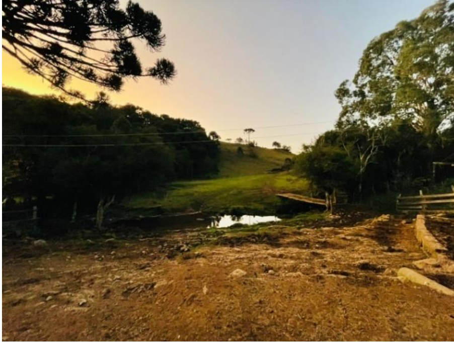
Figura 5 -Propriedade rural (Agric. 2) /Juá/São Francisco de Paula/RS

Imagens que ilustram o contexto dos locais visitados