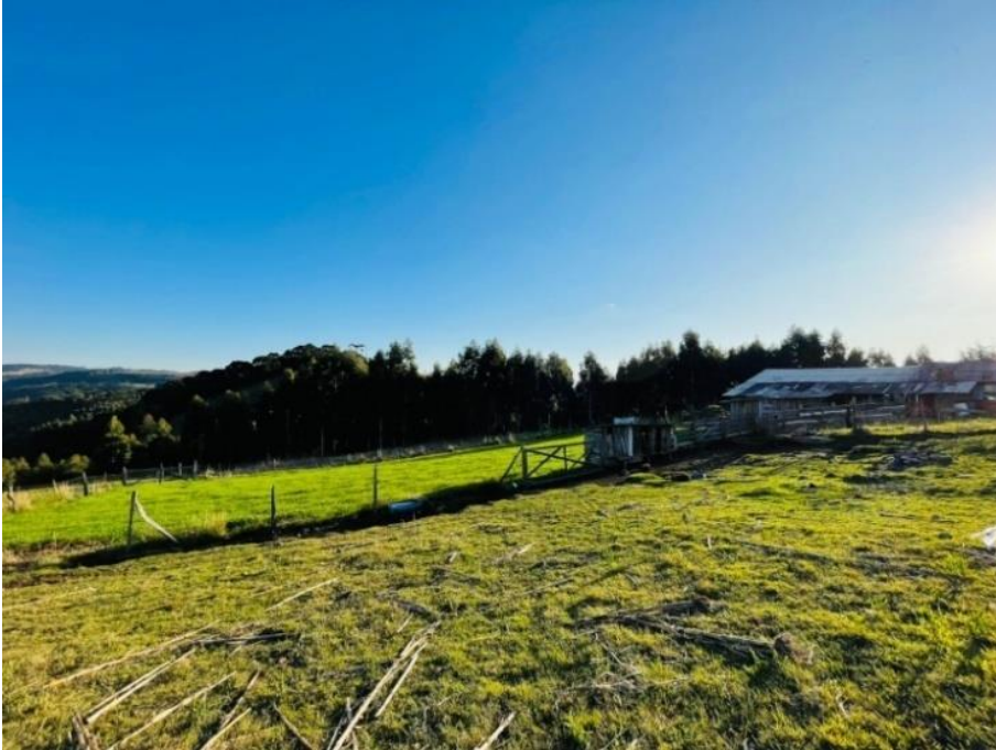
Figura 7- Propriedade (Agric. 1.) Juá/São Francisco de Paula/RS