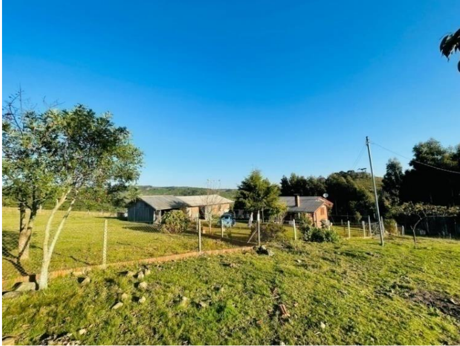
Figura 9-Propriedade (Agric.1) Juá/São Francisco de Paula/RS