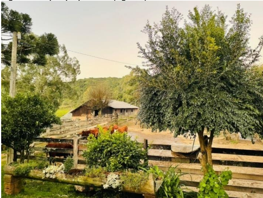
Figura 6- Galpão propriedade (Agric. 2)Juá