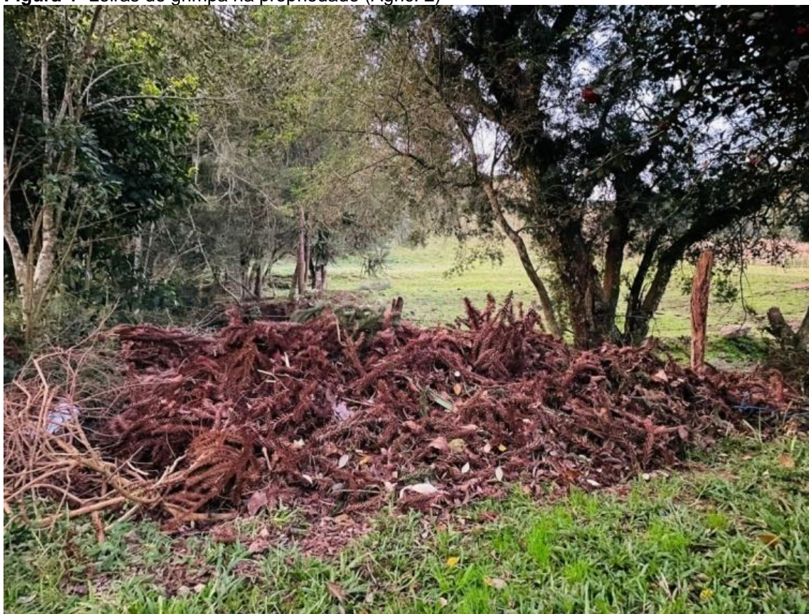
Figura 4- Leiras de grimpa na propriedade (Agric. 2)