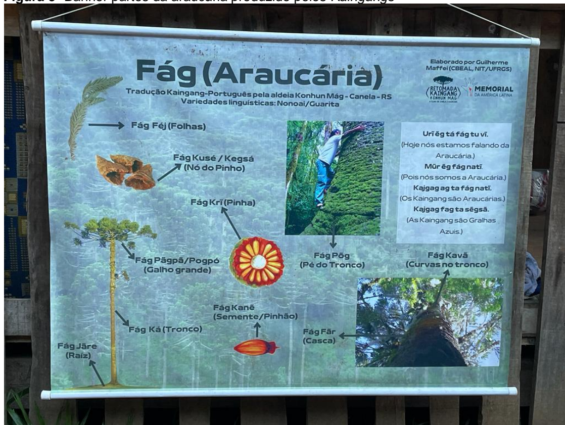
Figura 3- Banner partes da araucária produzido pelos Kaingangs