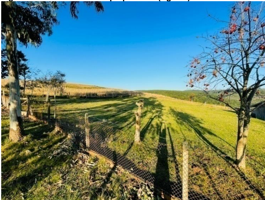
Figura 8- Lavouras de milho propriedade (Agric.1)