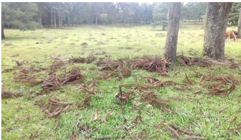
Figura 2 -Sítio no interior de Jaquirana/RS, campo com grimpa de araucária (2022).

A literatura acadêmico-científica vem apontando a necessidade de mudanças no manejo com a natureza de uma forma geral, não basta o discurso, a produção acadêmica, urge uma mudança de comportamento, aprender um novo jeito de fazer para harmonizar homem e natureza, produção e preservação. A imagem apresentada a seguir ilustra a desrama da grimpa pelas araucárias nos campos abertos, o que certamente dificulta a presença dos animais que buscam alimento.