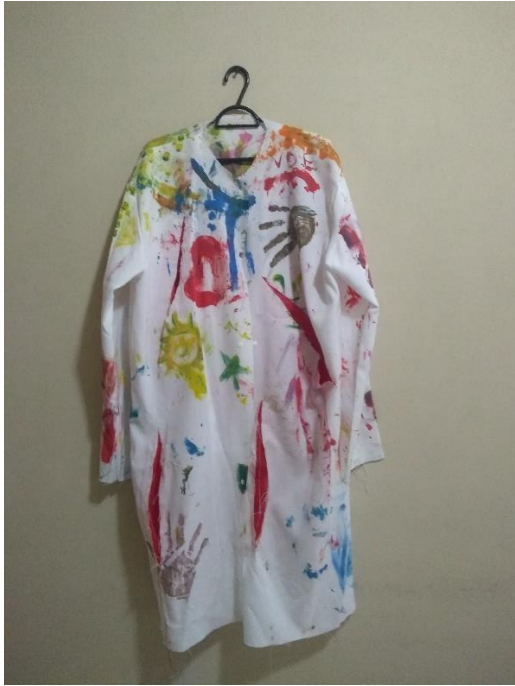
Figura 5 Foto do jaleco antropofágico (frente)