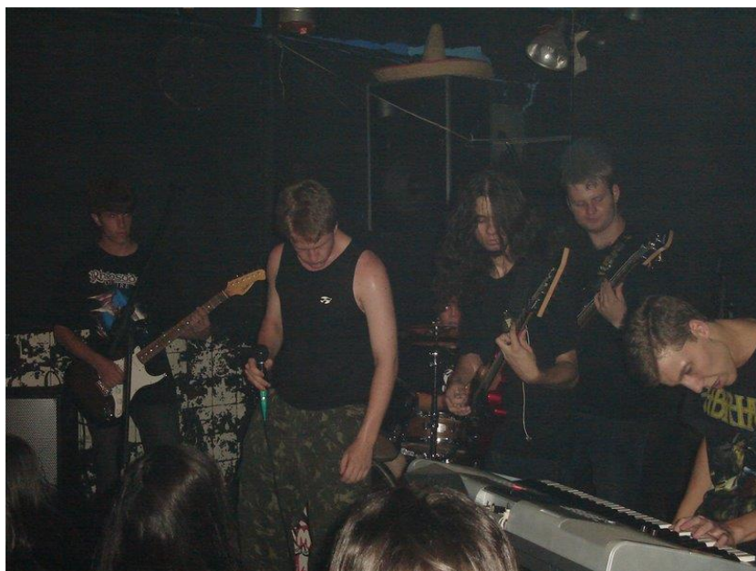
Figura 2 Apresentação da banda Midnight Sunset no antigo bar Pop Cult, em Novo Hamburgo, 2009

Em algum ponto, a banda Midnight Sunset chegou ao seu fim. Acredito que cada um deve ter uma visão sobre isso, mas a meu ver foi por um certo desgaste frente às frustrações de não conseguirmos uma dedicação equilibrada por parte de todos os membros da banda e também por causa de dificuldades financeiras como a questão de ter instrumentos e equipamentos de som de qualidade. Também por ser um gênero que se apoia muito na virtuosidade dos instrumentistas, a técnica necessária para tocar as músicas exigia muitas horas de prática por dia; e foi ficando cada vez mais difícil dispor desse tempo.