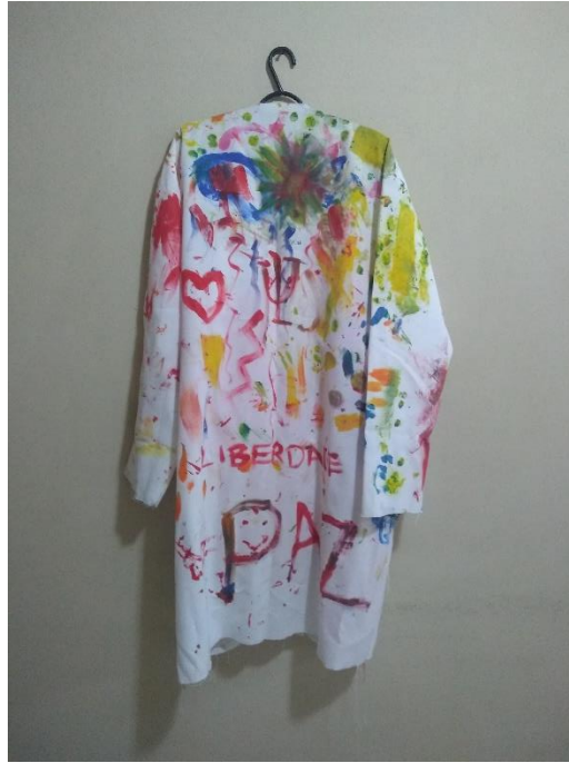
Figura 6 Foto do jaleco antropofágico (verso)