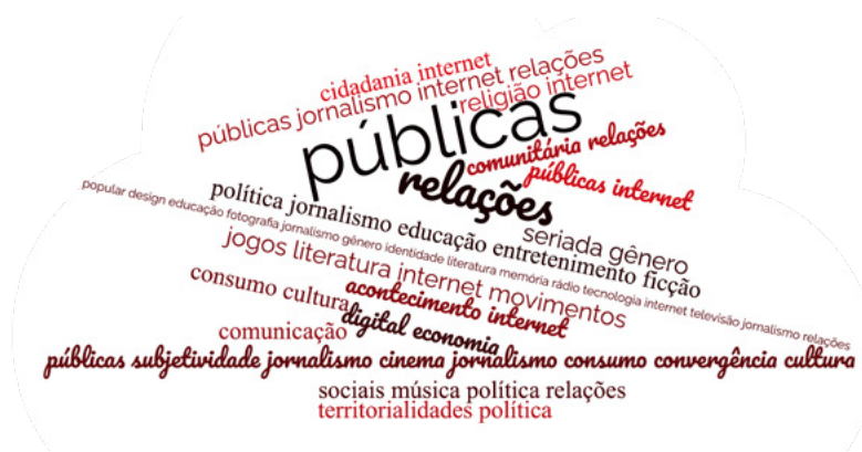
Figura 1 – Nuvem de palavras das subáreas e suas combinações no recorte sobre entrevista