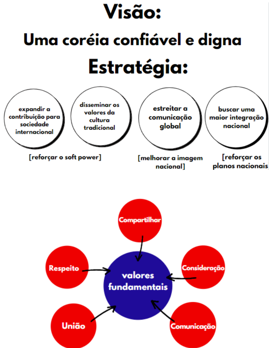
Figura 2 - Visão do Presidential Council on Nation Branding