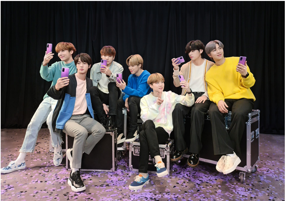
Figura 1 - BTS para a Samsung

cultural se expandiram nos últimos anos. Empresas como Samsung, Hyundai, LG e afins têm se utilizado do boom crescente dos grupos de k-pop e iniciado um movimento de parcerias com os cantores, em um esquema win-win (isto é, ganho mútuo) em que ambos se beneficiam. Isto é, os grupos de k-pop, ao poderem atingir públicos diferentes do que geralmente estão acostumados e, as empresas, ao conseguirem alcançar o público mais jovem, construindo a ideia de uma marca atrelada à imagem dos cantores.