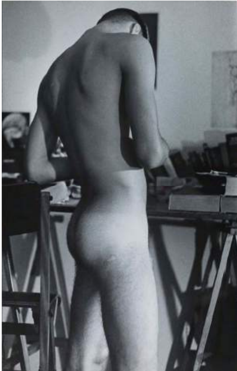
ALAIR GOMES: Fragmento de Symphony of Erotic Icons , 1966-1977. Coleção Fundação Biblioteca Nacional Rio de Janeiro