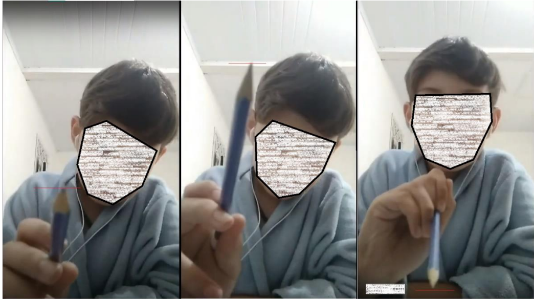
Figura 3 - Estabelecendo posições para os números