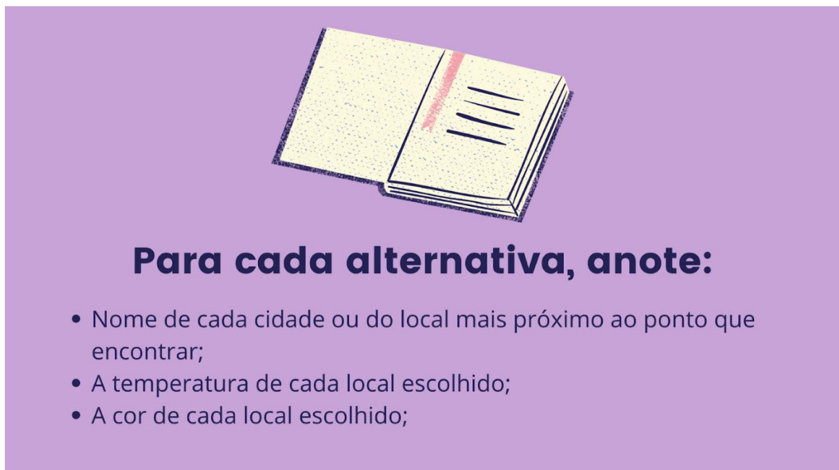
Figura 6 - Slide 2