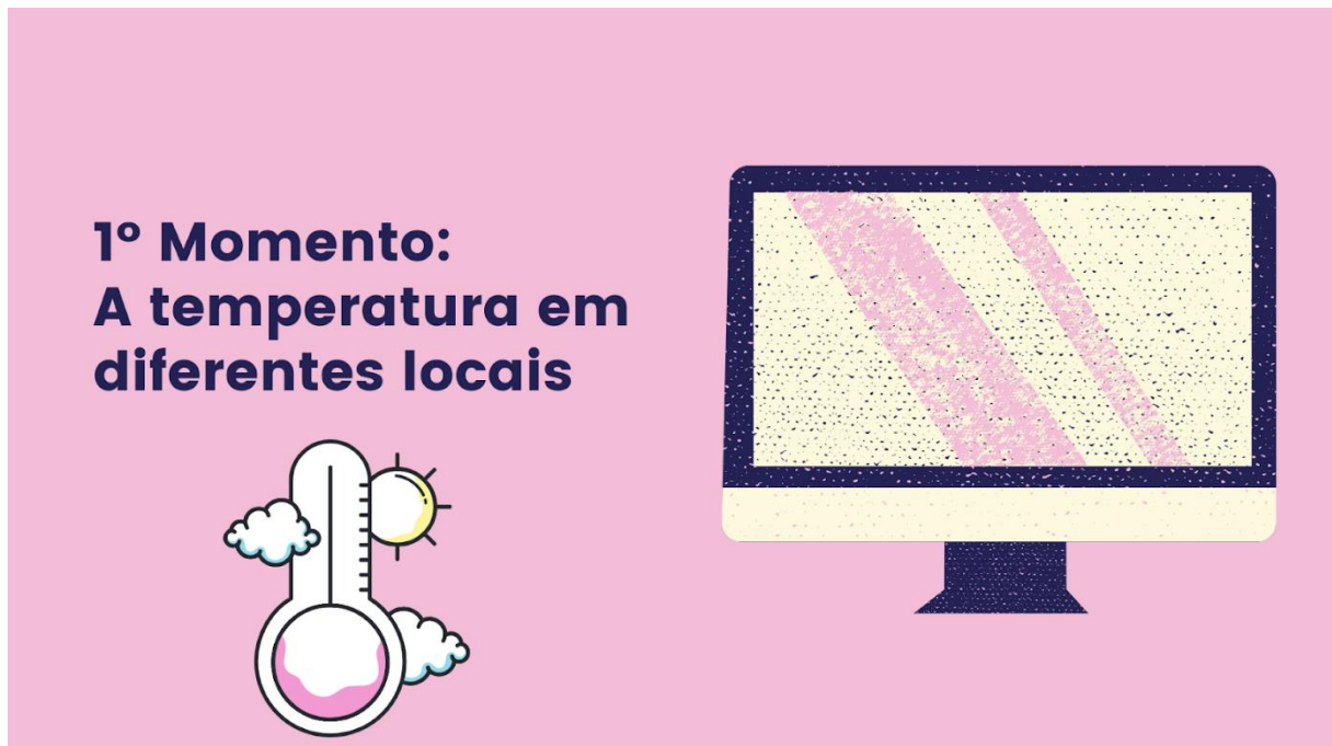
Figura 7 - Slide 3