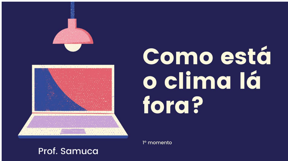
Figura 5 - Slide 1