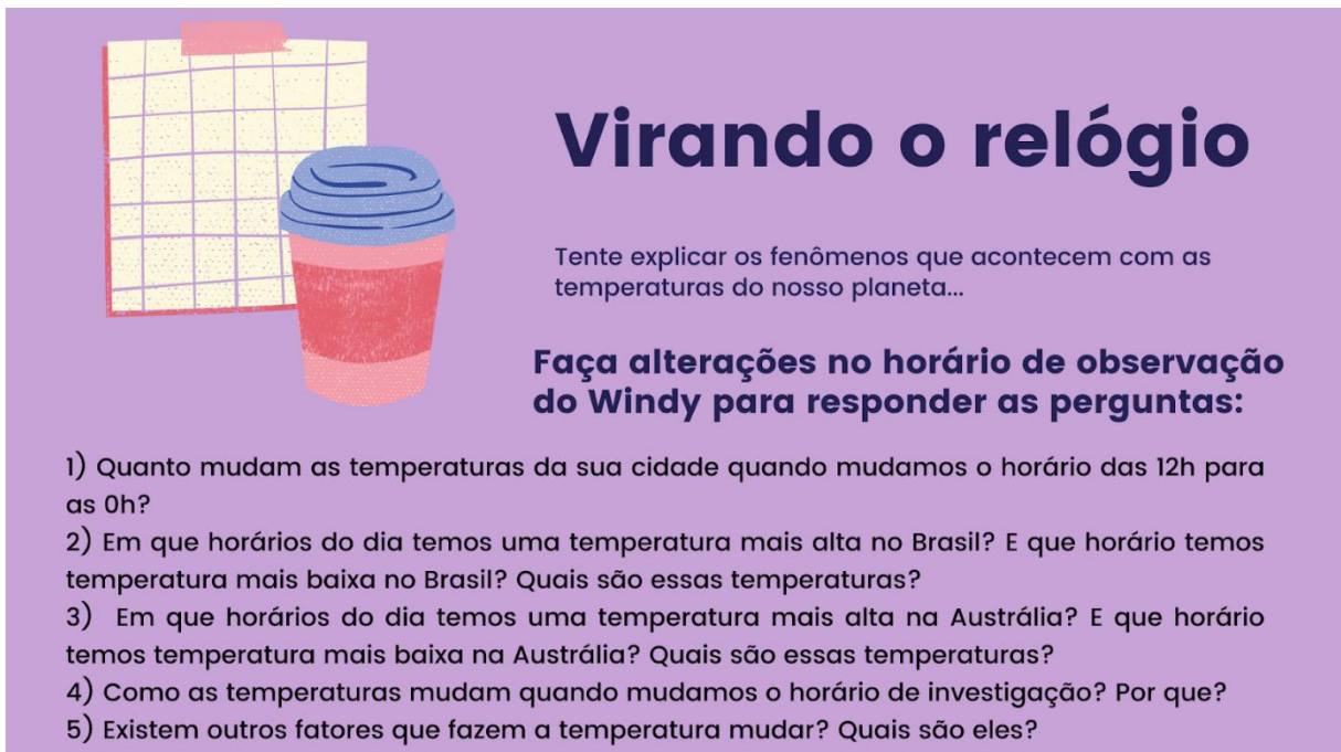
Figura 15 - Slide 11