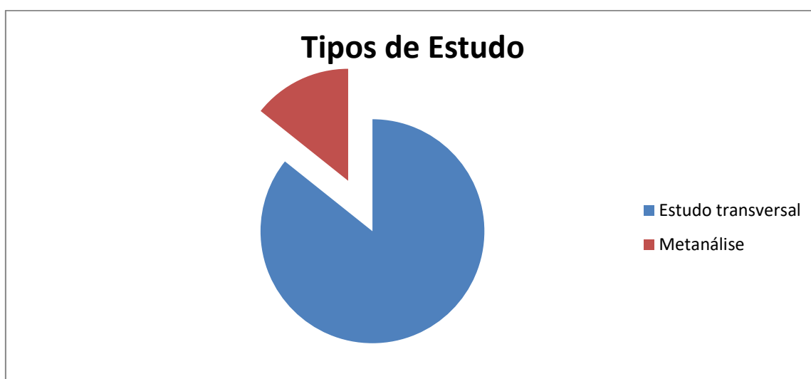
Figura 2 – Gráfico de distribuição dos artigos por tipo de estudo