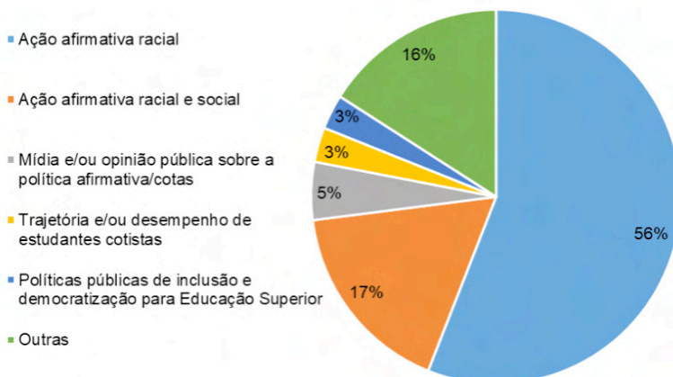
Gráfico 2 – Principais abordagens temáticas nas fontes

Sobre o tema geral, encontramos uma predominância quantitativa e qualitativa dos debates sobre raça, racismo e relações raciais no Brasil, especialmente com problematizações e interseções do tema quanto ao acesso à Educação Superior. No gráfico abaixo, é possível visualizar um panorama em porcentagens das abordagens temáticas nas 959 (novecentas e cinquenta e nove) fontes que compuseram o estudo: