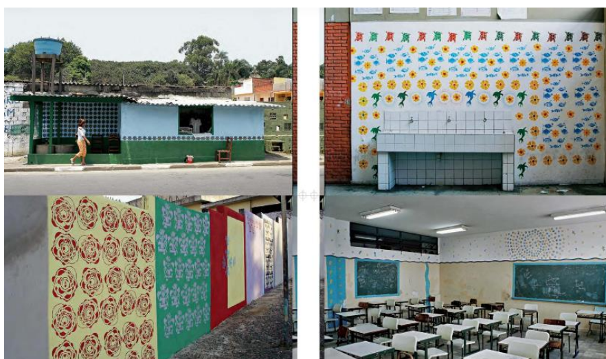
Figura 2. Imagens do Jardim Miriam Arte Clube (JAMAC) retiradas do catálogo da 27a Bienal de São Paulo (2006) 4 .

Apesar de no site da Bienal estar indicado que o público visitante poderia conferir esse trabalho utilizando uma linha especial de ônibus que partia do ponto de ônibus localizado no lado norte do pavilhão e conectava a Bienal e o Jardim Miriam. Não consta no catálogo da edição nenhuma informação sobre o ônibus que deveria levar os visitantes ao JAMAC. Consta sim no catálogo, apenas a presença de outra obra realizada pelo coletivo, que se encontrava dentro do pavilhão da Bienal, e informações sobre as fotografias das obras reproduzidas no próprio catálogo (Figura 2).