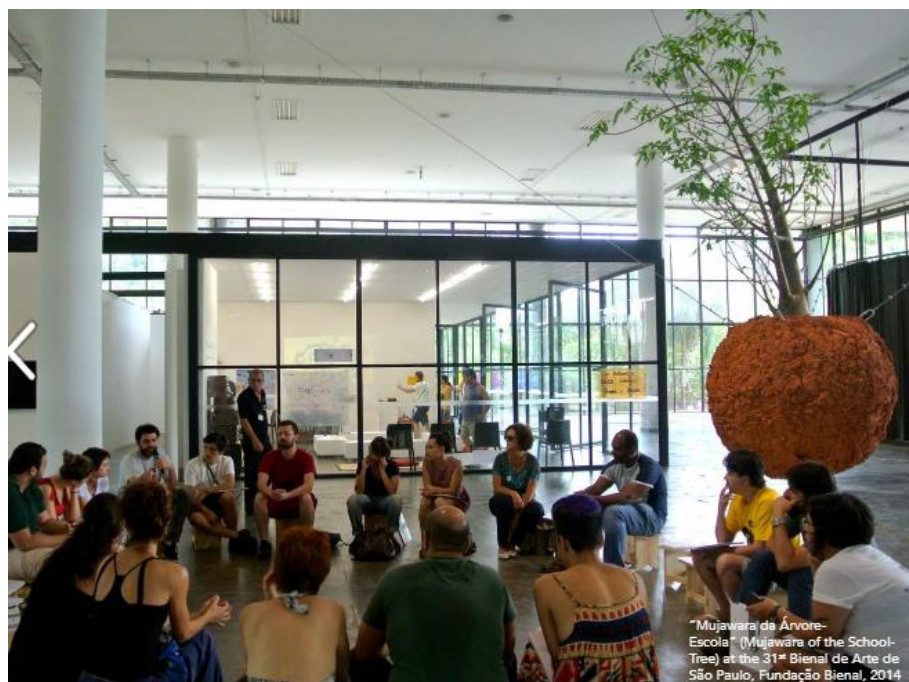
Figura 3. Imagem de ativação da obra Mujawara da Árvore-Escola, realizada em colaboração entre os artistas Alessandro Petti, Sandi Hilal e coletivo brasileiro Contrafilé para a 31ª Bienal de São Paulo (2014).

Como situação principal e que abriga as demais, uma mujawara foi estabelecida no sul da Bahia entre refugiados palestinos, quilombolas, teóricos, artistas, indígenas e sem-terra. Atuando em rede (Figura 3), foram promovidas conversas e situações potencializadoras do debate sobre deslocamento, exílio e construção de identidade – conceitos inerentes à definição contemporânea de coletividade. Esse trabalho em parceria teve como frutos a publicação de um livro que conta sua história e uma instalação na área Parque da 31ª Bienal. Dois projetos sociais, provenientes de contextos diferentes, que cooperaram para a criação desta prática artística 5 .