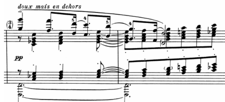
Figura 34: compassos 11 e 12 de " Danseuses de Delphes ", de Claude Debussy, com acordes em bloco com vozes paralelas.

Do prelúdio n. 1 (“ Danseuses de Delphes ”) do mesmo livro (figura 34), foi adaptada a ideia de sequências de acordes com estrutura fixa (faixa sonora), nos quais todas as vozes se movimentam paralelamente, formando disposições intervalares similares. Para esta canção, foi adotado ainda, como referência de sonoridade para os acordes, o intervalo entre fundamental e sétima na mão esquerda, comum nas “ Canções de Amor ”, compostas em parceria por Claudio Santoro e Vinicius de Moraes. O uso de acordes com sétima maior, em especial contendo o empréstimo modal do grau bVII é uma escolha cuja influência se deu a partir de canções como “ Dindi ” de Tom Jobim, e “ O Trem Azul ”, de Milton Nascimento (1942 -) e Lô Borges (1952 -).