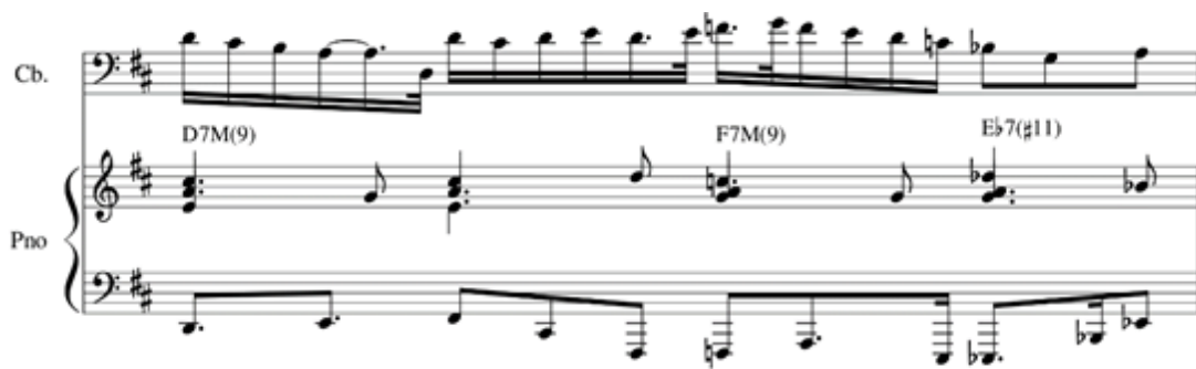
Figura 3: compasso 10 da peça “Sete Anos de Pastor Jacob Servia”, com um interlúdio instrumental.

Após um interlúdio instrumental curto (figura 3), a parte A é repetida com o mesmo material, mas com novo texto e contrabaixo em pizzicato . A figuração rítmica do piano também se altera, com arpejamentos na mão esquerda (figura 4).