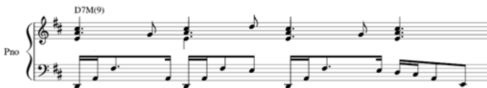
Figura 4: comparativo entre as figurações do piano em A (a) e A' (b).