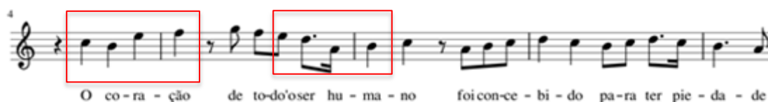
Figura 40: compassos iniciais de “ Piedade ”, com destaque para o motivo utilizado na entrada da voz, seguido de um de seus desenvolvimentos.

música (figura 40). Ao final dos oito primeiros compassos da parte A (5 a 12), um acorde de dominante marca o retorno à mesma sequência de acordes e repetição da melodia com pequenas variações.