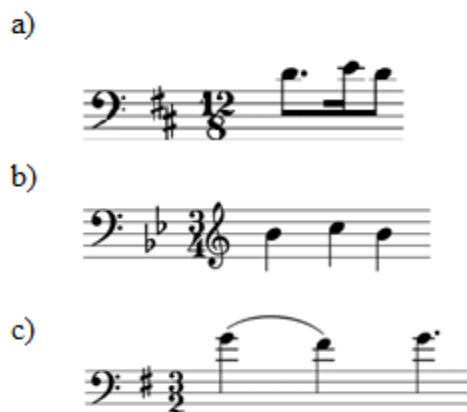
Figura 16: comparativo da célula rítmico-melódica inicial das melodias de “ Sete Anos de Pastor Jacob Servia ” (a), “ Amor, co’a Esperança Já Perdida ” (b) e “ Alma Minha Gentil, que te Partiste ” (c).

Na introdução e em grande parte da peça, as notas da melodia do contrabaixo e dos acordes do piano duram mais no segundo tempo do compasso do que no primeiro, sugerindo o apoio rítmico característico da sarabanda. O mesmo material inicial é utilizado na melodia vocal (figura 17), mantendo na acentuação do texto a ênfase no segundo tempo típica da sarabanda, e a seguir apresentando movimento ascendente por graus conjuntos. A influência para essa escolha veio do texto, como forma de ilustrar a partida da personagem como uma subida. O uso da tensão de 13 a menor no compasso 6 também ajuda a marcar o desconforto gerado pela situação do texto. Recursos semelhantes aparecem nos compassos 7-8, em que na palavra “repousa” há uma descida por grau conjunto a uma consonância perfeita, seguido de uma escala ascendente até a nota mais aguda utilizada até então, que é acompanhada pela palavra “Céu”.