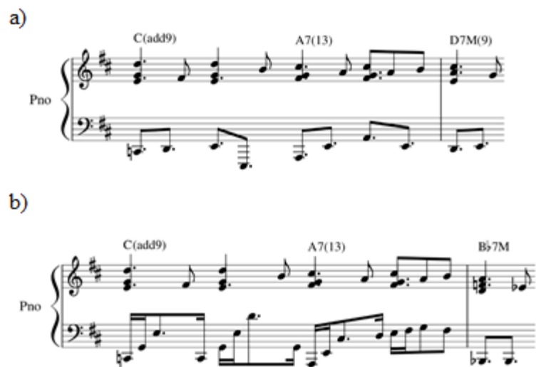
Figura 5: comparativo entre as resoluções do acorde A7(13) ao final de A (a) e A' (b).

A sonoridade atingida pelas alterações de timbre, bem como pela inserção de novas regiões harmônicas no interlúdio (mediante cromática superior e subV7), renovam o interesse em direção à repetição variada de A (seção A'). Cabe ressaltar que os ritmos recorrentes da mão esquerda do piano e do contrabaixo em A' se relacionam ao texto através da imagem da personagem repetindo obstinadamente sua rotina, narrado nos versos “Os dias, na esperança de um só dia, passava, contentando se com vê-la (...)”. Ao final da seção, o acorde A7(13) é resolvido com movimento do baixo meio tom acima (Bb), e o trítone (dó#-sol) é resolvido em ré-fá, terça maior e quinta justa de Bb (figura 5).