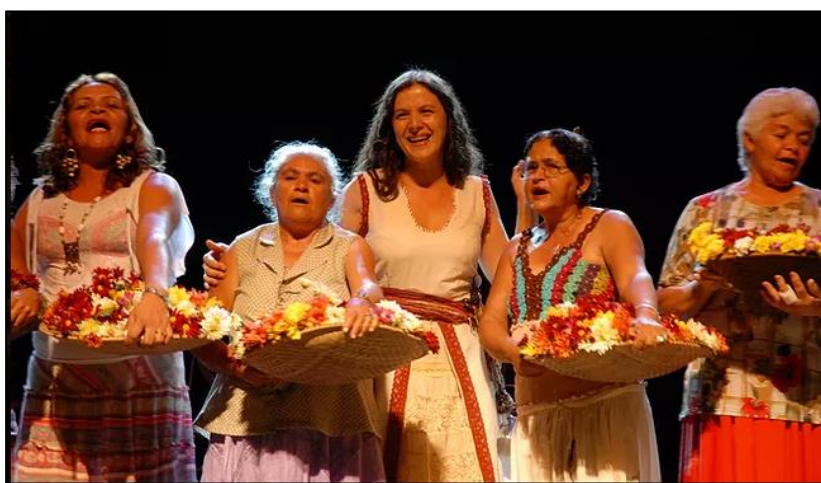
Figura 1 - Show do CD Cantos de Trabalho com as destaladeiras de fumo