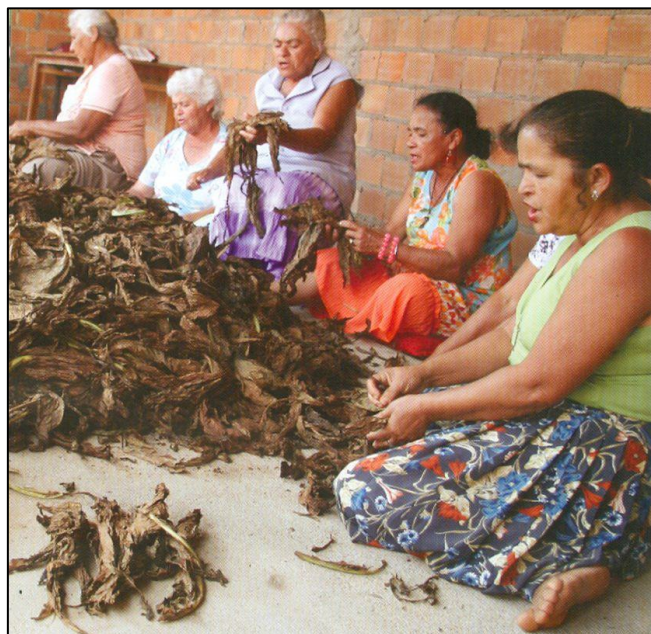
Figura 4 - Destaladeiras de Fumo de Arapiraca/AL