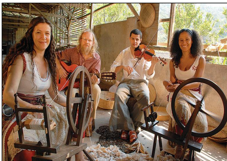
Figura 2- Grupo Cia. Cabelo de Maria