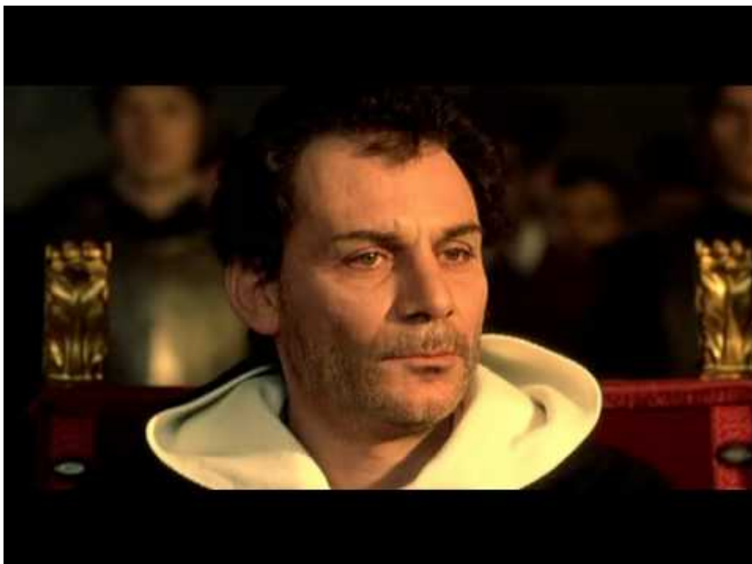
Figura 4— Imagem do personagem Giordano Bruno durante o julgamento