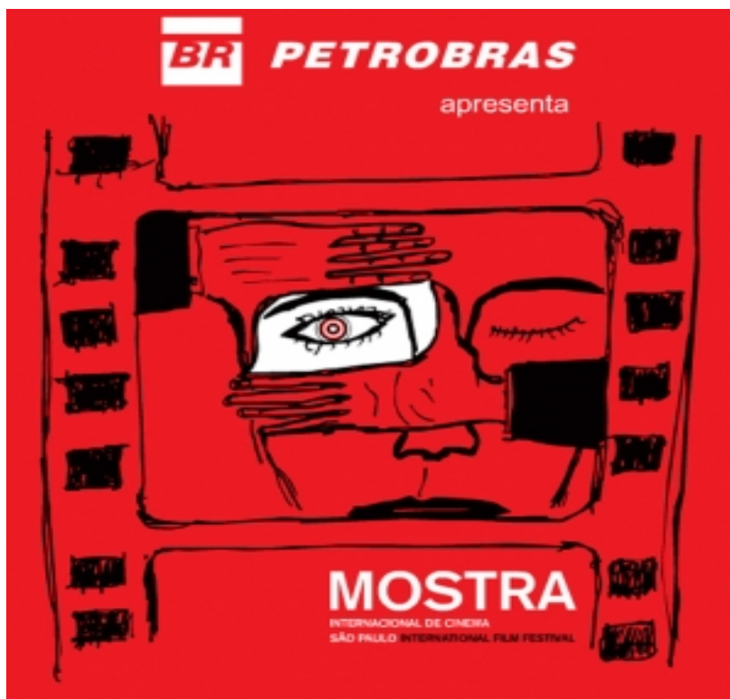
Figura 14—Imagem da foto utilizada para divulgação a mostra internacional de cinema de São Paulo de 2006