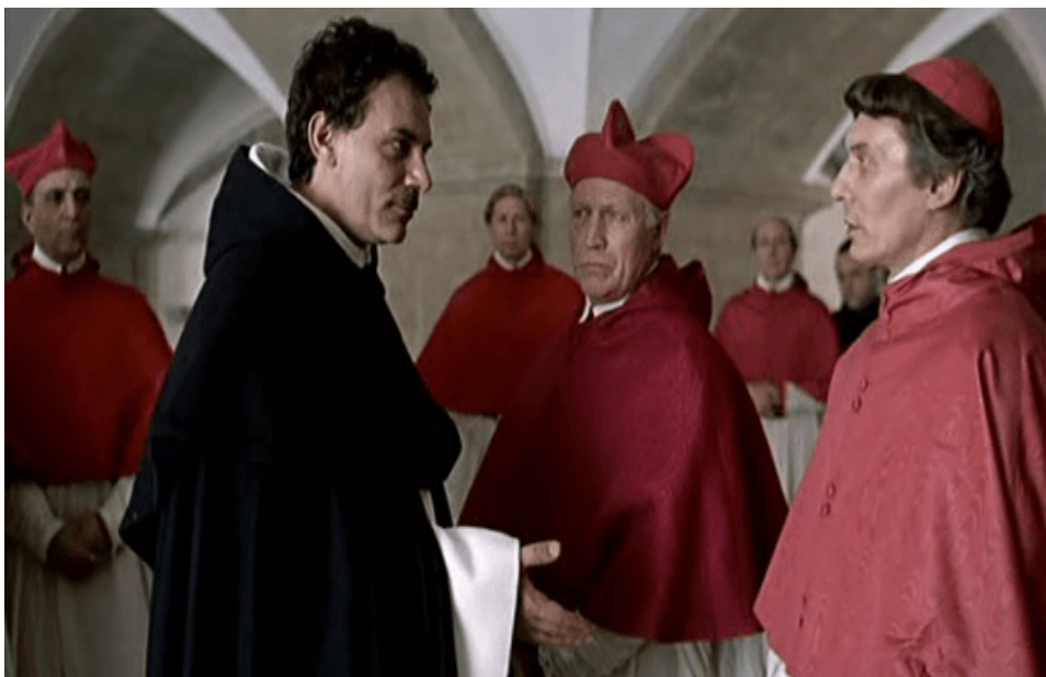
Figura 6— Último julgamento do personage Giordano Bruno