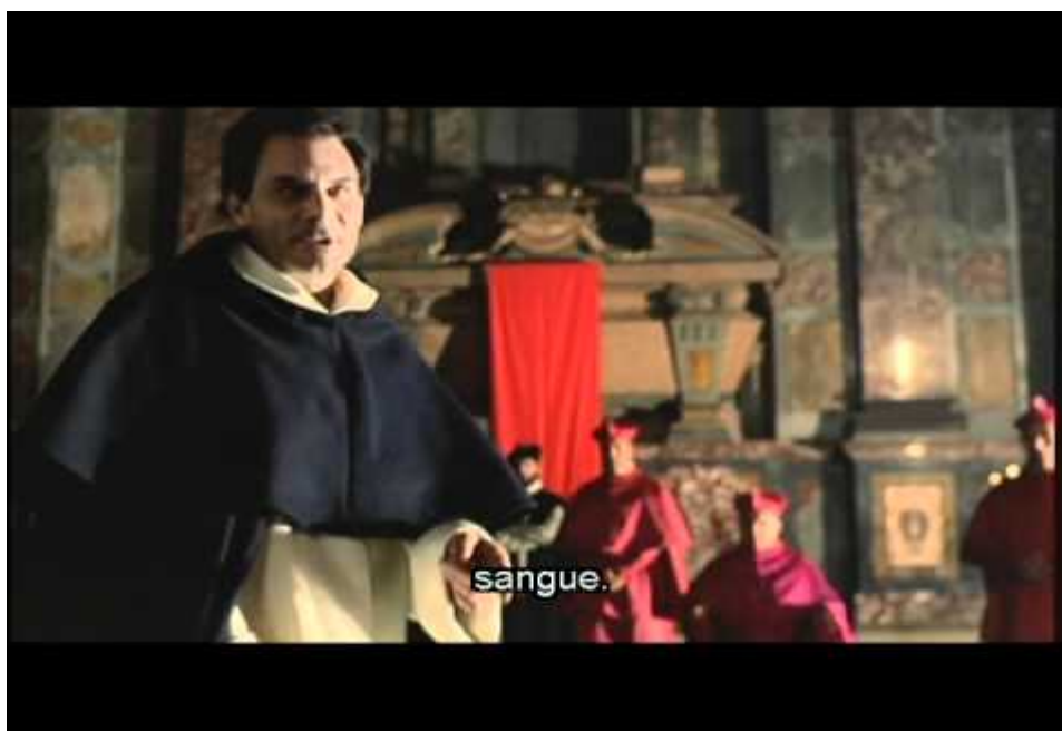
Figura 8— Discurso de Giordano Bruno de defesa antes de ser condenado