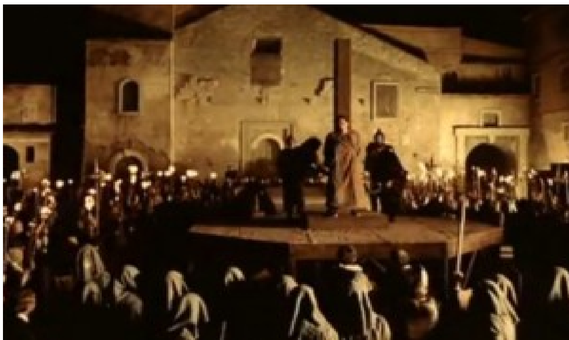
Figura 3— Martírio do personagem Giordano Bruno como encerramento do filme