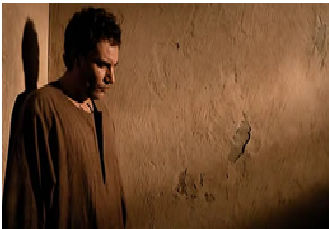
Figura 10— Momentos finais de Giordano Bruno