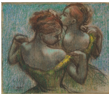
Figura 9: Edgar Degas (1834-1917).

Disponível em: < http://emuseum.toledomuseum.org/objects/50814 >.