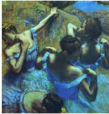
Figura 4: Edgar Degas (1834-1917). Danseuses Bleues, 1899. Pastel sobre papel, 65x65 cm. Pushkin State Museum of Fine Arts, Moscou. Disponível em: < https://goo.gl/8YaBXn >.