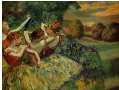
Figura 5: Edgar Degas (1834-1917). Quatre Danseuses, 1899. Óleo sobre tela, 151,1x180,2 cm. National Gallery of Art Washington. Disponível em: < http://www.nga.gov/collection/art-object-page.46597.html >.