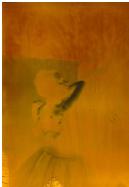
Figura 2: Edgar Degas (1834-1917). Danseuse ajustant sa bretelle, 1895-1896. Negativo monocromático em vidro, 13x18 cm. Bibliothèque Nationale de France (BnF), Paris. Disponível em: < http://goo.gl/g3LVgZ >.