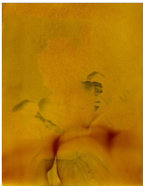
Figura 3: Edgar Degas (1834-1917). Danseuse ajustant ses deux bretelles, 1895-1896. Negativo monocromático em vidro, 13x18 cm. Bibliothèque Nationale de France (BnF), Paris. Disponível em: < http://goo.gl/yLUWnr >.

Em nossa pesquisa, podemos situar estas mesmas poses fotográficas utilizadas e transformadas em um processo de tradução da fotografia em pintura, na composição de outras de suas obras (Figuras 5-9).