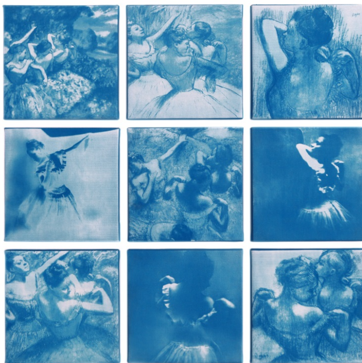
Figura 10: Dani Remião. Danseuses Bleues, 2017. Cianotipia sobre tela, 20x20 cm (políptico). Porto Alegre (RS).

Com base no mergulho na obra de Edgar Degas, passei a elaborar um trabalho intitulado Danseuses Bleues (Figura 10). Trata-se de um políptico composto de nove telas, trazendo a reprodução fotográfica de recortes de obras do artista.