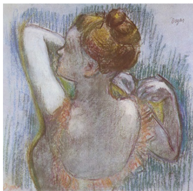
Figura 7: Edgar Degas (1834-1917).