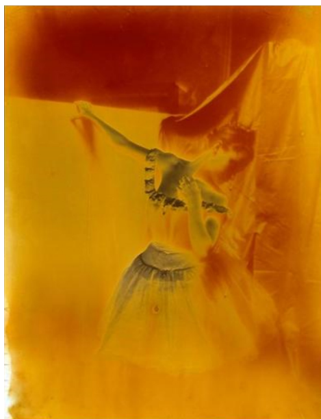
Figura 1: Edgar Degas (1834-1917). Danseuse le bras tendue, 1895-1896. Negativo monocromático em vidro, 13x18 cm. Bibliothèque Nationale de France (BnF), Paris. Disponível em: < http://goo.gl/QzJwjm >.