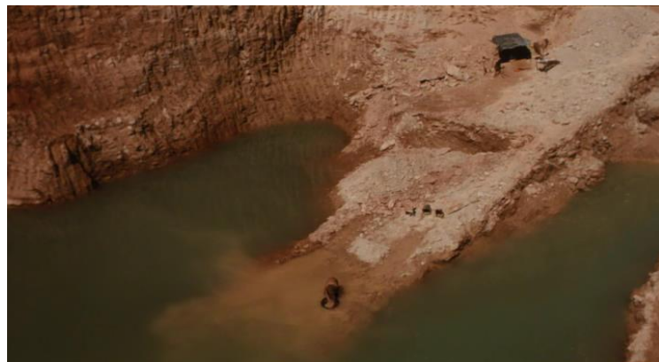
Figura 2 - Quadro naturalista em Latitude zero