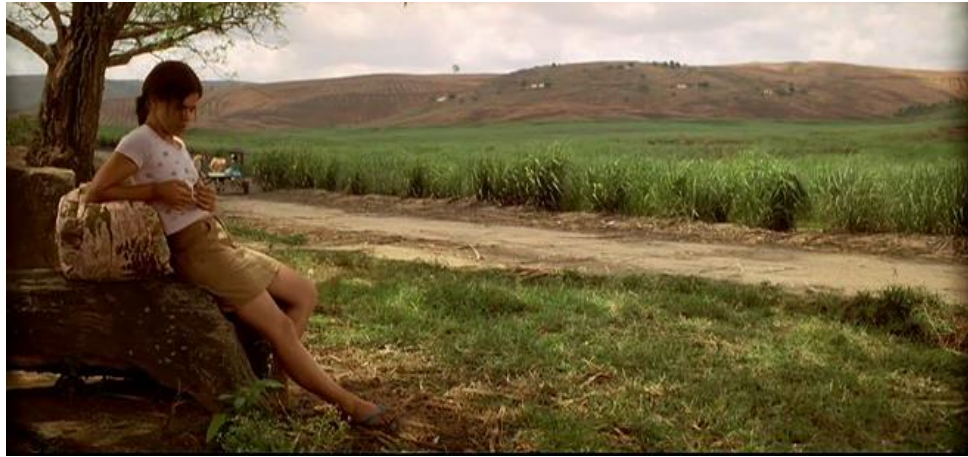
Figura 1 - Quadro naturalista em Baixio das bestas

no final de Amarelo manga ); às vezes por meio de longos deslocamentos de câmera e personagem, que produzem uma imersão no espaço nos filmes ( Contra todos , Amarelo manga , O invasor ). Quanto aos deslocamentos, destacam-se por serem circulares em torno de centros, que funcionam como epicentros da doença e da miséria (o hotel em Amarelo manga , a casa de subúrbio em Contra todos , a pequena comunidade em Baixio das bestas ) 3 .