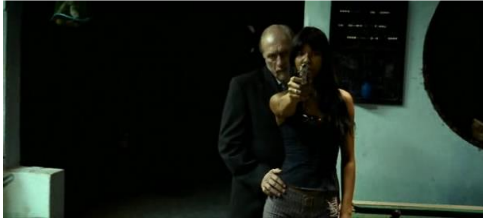
Figura 4 - Morte simbólica em câmera subjetiva do personagem naturalista em Árido movie

mas opta finalmente pelo outro lado do dualismo que havia criado para si próprio, isto é, o lado da força da cultura sobre a hereditariedade.