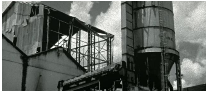
Figura 3 – Plasticidade e ação destrutiva do tempo em Baixio das bestas

também momentos de beleza plástica, como aquele em que a câmera em contra-plongée direciona-se para as nuvens que passam, enquadrando a meio caminho o prédio da usina em degradação, com imagem em preto e branco e granulada, ao passo em que, em voz over, o narrador-poeta recita acerca da inevitabilidade da ação destrutiva do tempo 4 . A imagem sintetiza plasticamente a insuficiência da construção humana e histórica (usina) frente à ação entrópica do tempo (nuvens).