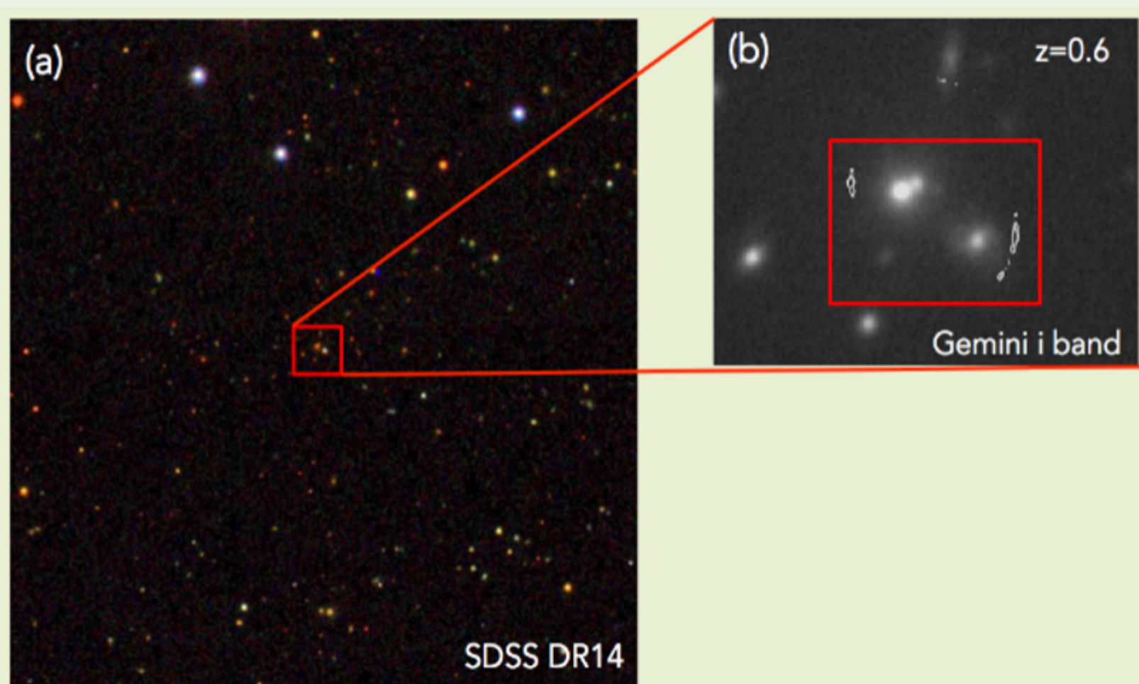
Figura 1: (a) Imagem com composição colorida do SDSS do grupo de galáxias. (b) Imagem na banda i do Telescópio Gemini da região mais interna do grupo, com as duas galáxias centrais. Os contornos brancos sobrepostos correspondem à imagem lanteada da galáxia submilimétrica HELMS18, obtida com o interferômetro ALMA.

O estudo de grupos de galáxias oferece uma importante perspectiva sobre como a estrutura em grande escala do Universo se formou e evoluiu, pois os grupos de galáxias preenchem a lacuna entre galáxias individuais e aglomerados de galáxias. O objetivo deste projeto é investigar as propriedades de um grupo de galáxias que está lanteando gravitacionalmente a galáxia submilimétrica HELMS18, que encontra-se em desvio para o vermelho z = 2,39 e foi detectada no Herschel's HerMES Large Mode Survey (HELMS; Nayyeri et al. 2016 ApJ, 833, 22). Dados no óptico (figura 1) indicam que esse grupo de galáxias está em z = 0,60 e que possui duas galáxias centrais, uma galáxia elíptica e um quasar. Através das observações de espectroscopia multi-objeto deste grupo de galáxias com o instrumento GMOS (Gemini Multi-Object Spectroscopy) do telescópio Gemini, pretendemos determinar os membros do grupo e obter a massa, o raio e o perfil de densidade numérica das galáxias deste grupo.