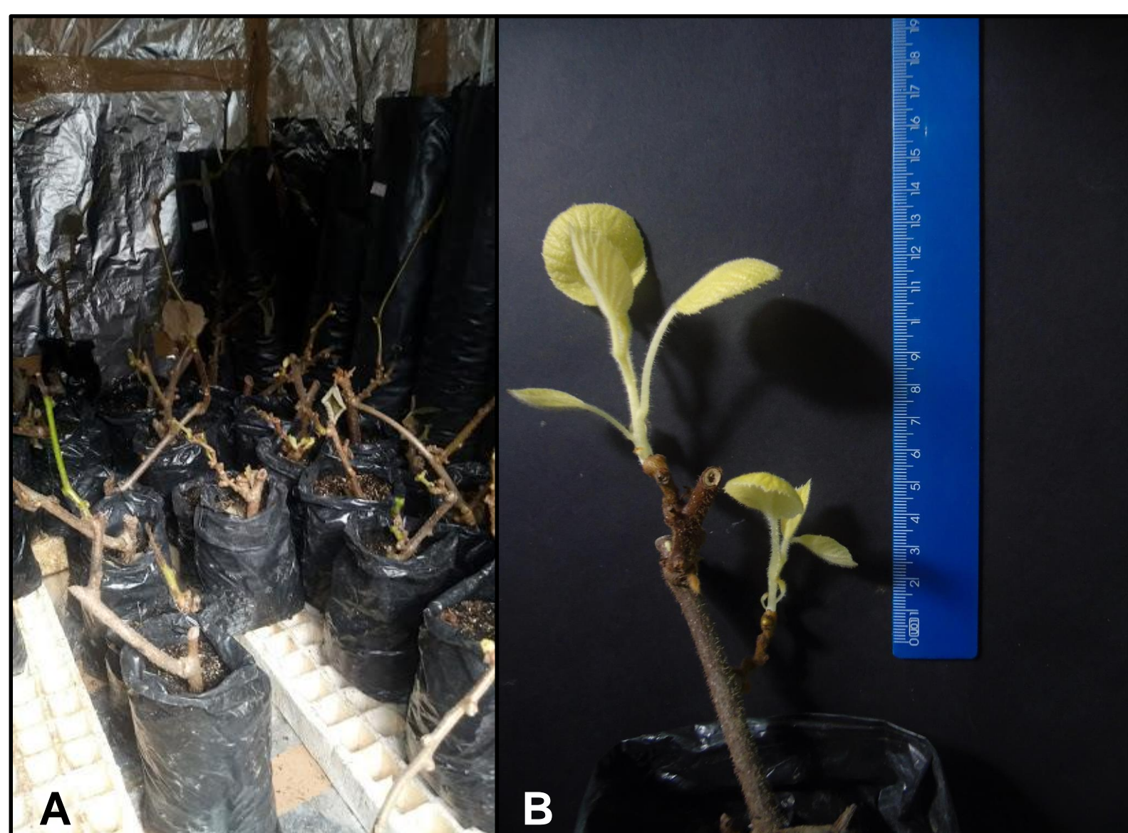
Figura 1. Câmara escura com temperatura de 35°C (A) e brotações apicais de kiwizeiro cv. Bruno estioladas (B).