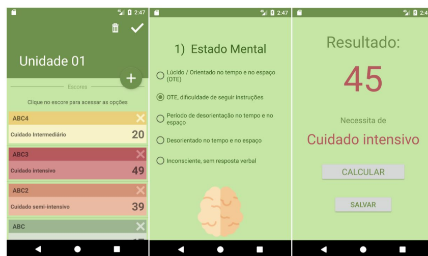
Figura 2. Aplicativo dimensionamento de pessoal de enfermagem

O app apresenta as funcionalidades: cadastramento da unidade de internação; sistema de classificação do paciente; e cálculo de dimensionamento de pessoal. Com o app, os alunos podem, para cada leito/paciente de uma unidade cadastrada, avaliar a complexidade do cuidado necessário. A escala utilizada contempla nove critérios padronizados, que podem ser avaliados à beira do leito utilizando dispositivos móveis. Em seguida, o professor pode finalizar o cálculo do dimensionamento, tendo como retorno o número mínimo de enfermeiros e técnicos de enfermagem para compor a equipe na respectiva unidade. O app mostra cada etapa do cálculo de dimensionamento para ser contextualizado junto aos alunos.