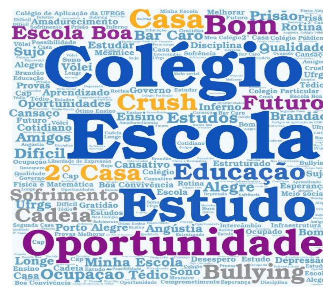
Organização: os autores (2018)