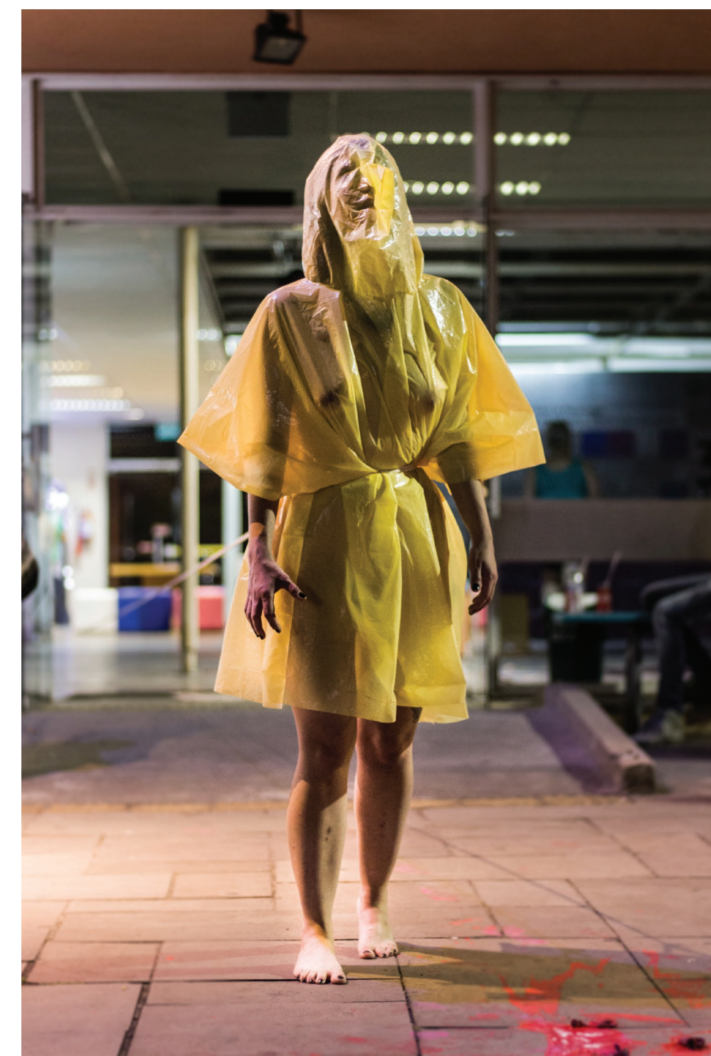
Registro da performance Margem (2018)