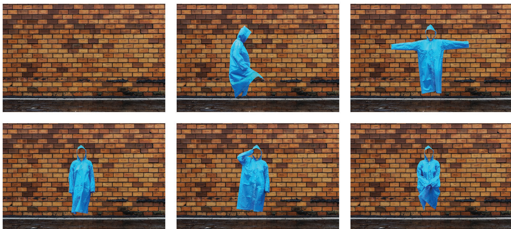
Fotoperformance Exo (2018)

A pesquisa Práticas Urbanas: Poéticas da Aproximação tem como ponto central as aproximações poéticas no espaço urbano do 4º Distrito de Porto Alegre, tendo como ponto de partida estratégias de errâncias e ações de inserção por meio de residências artísticas na região. Dentro desta, desenvolvo minha pesquisa individual Laboratório de experimentos anti-invisibilidade , que trata sobre a invisibilização da mulher perante a nossa sociedade, através de ações em vídeo, performance e fotografia.