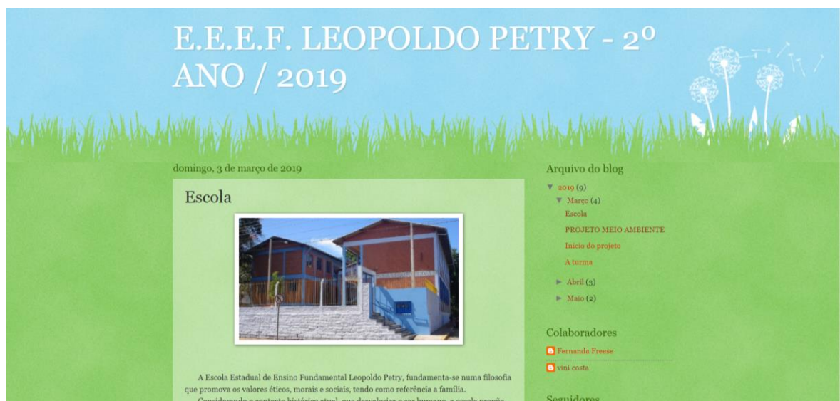
Figura 6: A escola – área externa