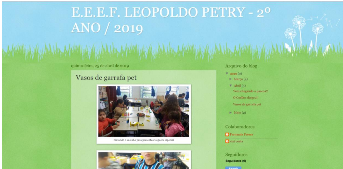
Figura 11: Confeção de vasinhas