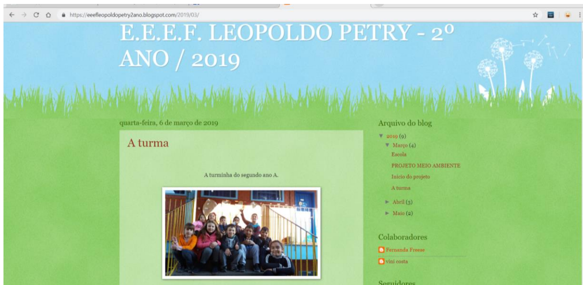
Figura 8: A turma do 2º Ano