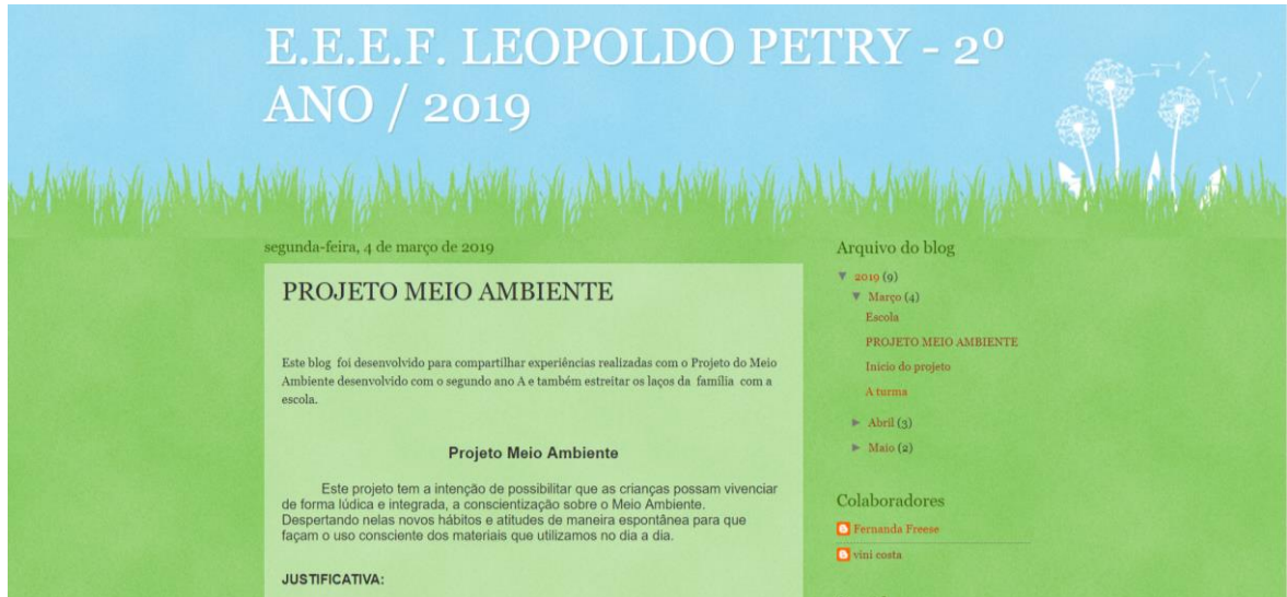
Figura 7: Apresentação do Projeto Meio Ambiente