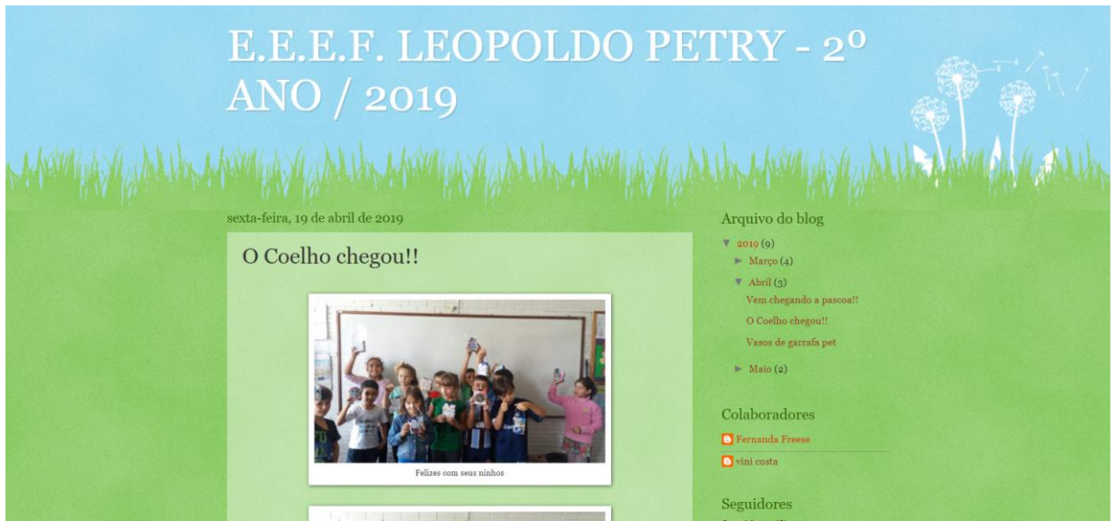
Figura 10: O Coelho chegou !!