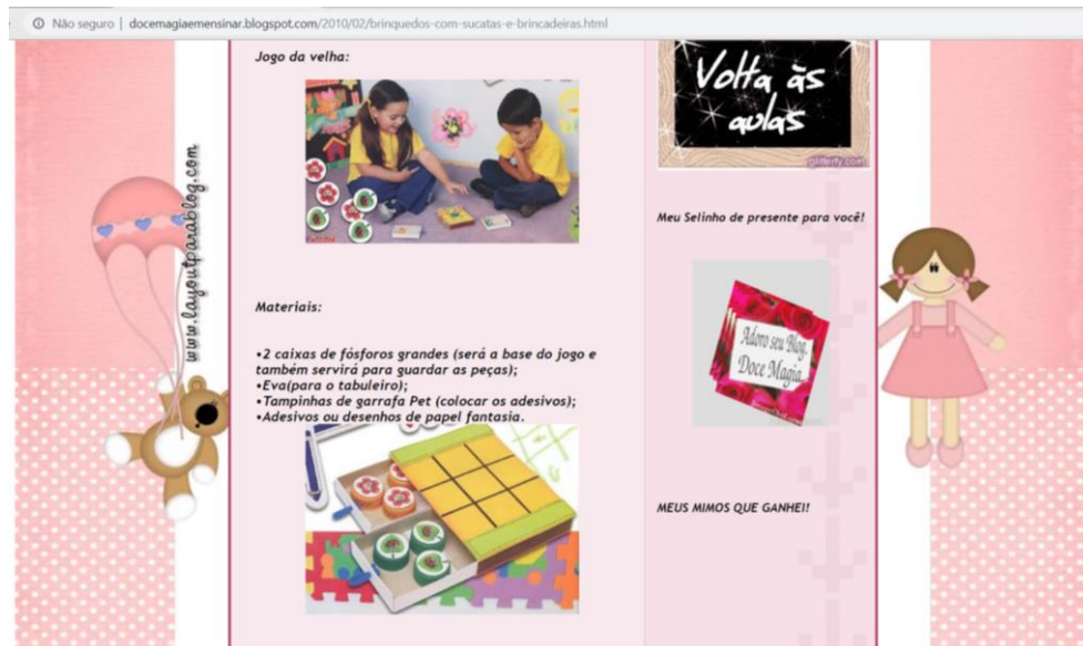
Figura 5 – Jogo da Velha