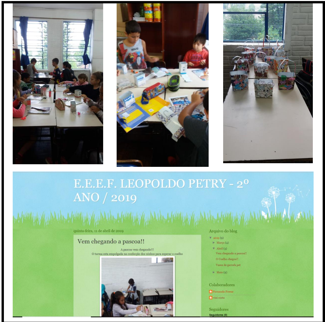
Figura 9: Vem chegando a páscoa !!