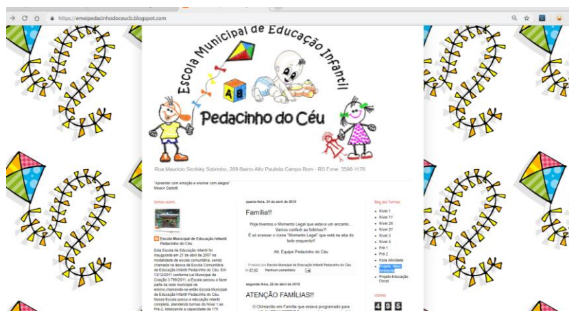
Figura 3 – Página inicial do blog – Pedacinho do Céu