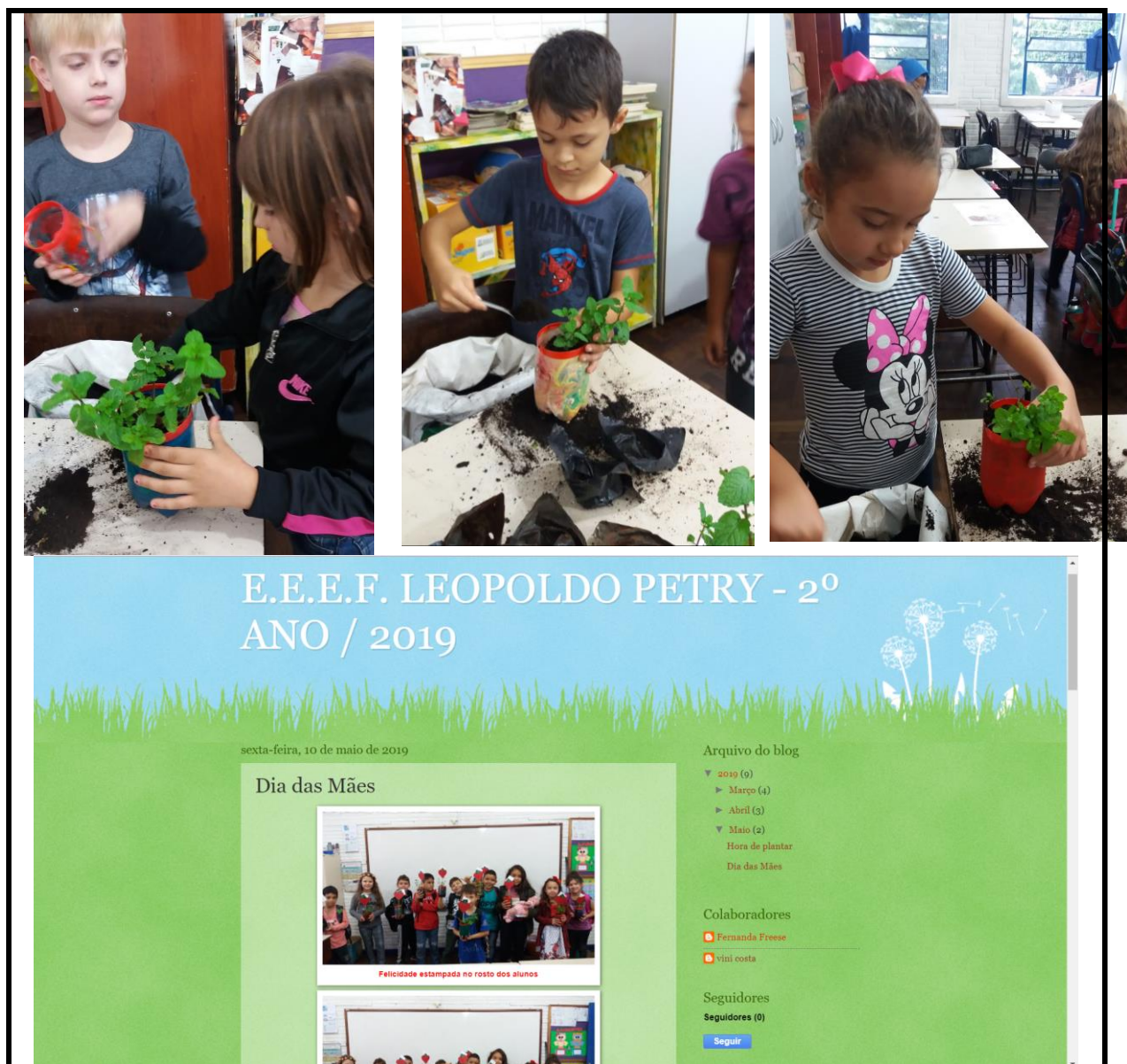
Figura 12: Presentando as mães !!!