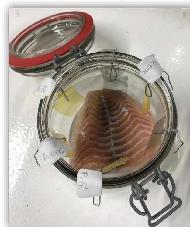
Figura 4 – Filmes com o peixe após dois dias fora de refrigeração.