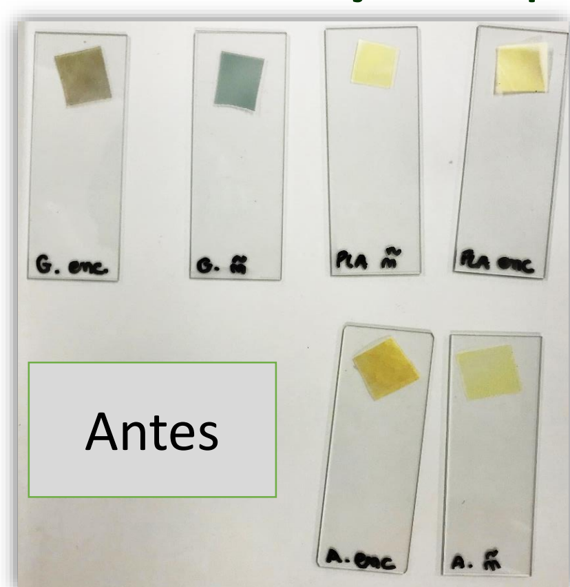
Figura 1 – Filmes antes do teste.