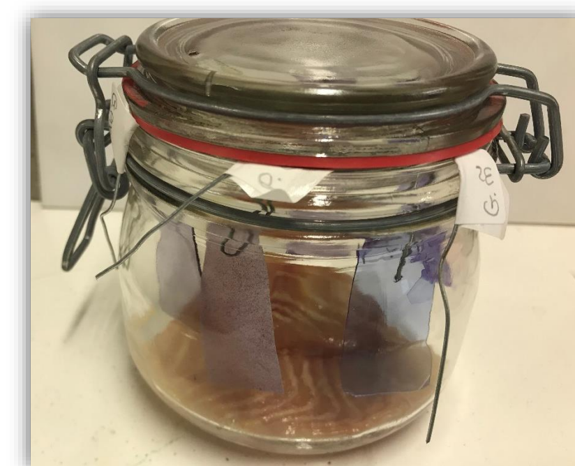
Figura 5 – Filmes com o peixe após dois dias fora de refrigeração.