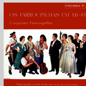
Disco de 1960