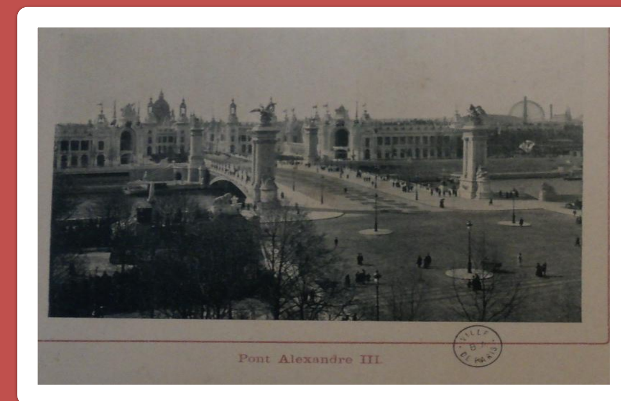
Ponte Alexandre III, L'Exposition Universelle Paris 1900 , acervo da Biblioteca da Prefeitura de Paris

Le Grand Palais, L'Exposition Universelle Paris 1900 , acervo da Biblioteca da Prefeitura de Paris