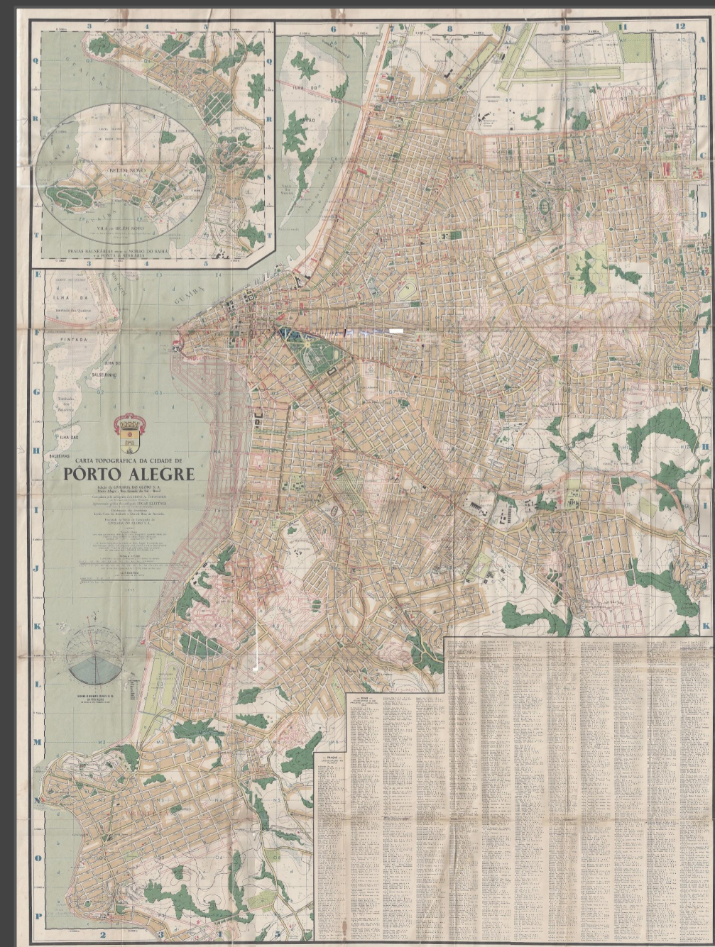
Carta Topográfica de Pôrto Alegre, 1955. Versão de bolso original.